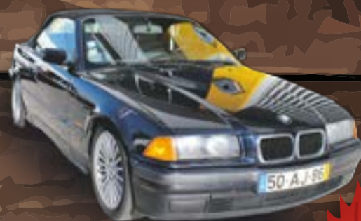
BMW 318 Cabriolet 2000 9.950,00€

Telefones: Geral: 219 382 910 Fax: 219 387 235