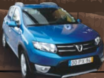
Dacia Sandero STEPWAY 1.5 DCI 90 CV 2015 16.500,00€