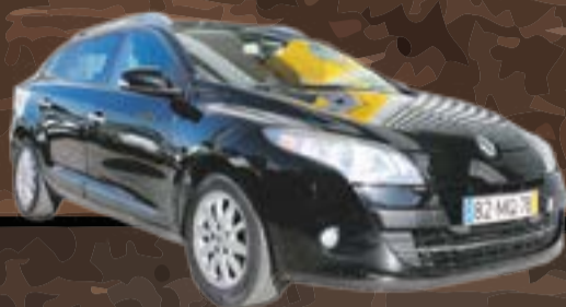
Renault Megane Sport Tourer DYNAMIQUE 1.5 DCI 110 CV 2012 15.950,00€