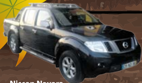
Nissan Navara 2.5 dci 190 cv CD SE 2013 28.000,00€