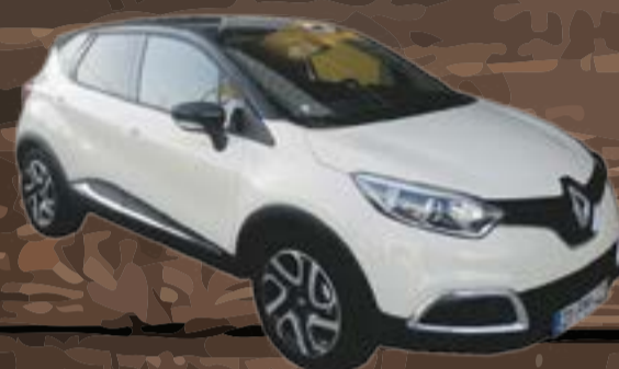
Renault Captur EXCLUSIVE 1.5 DCI 90 CV 2015 20.450,00€