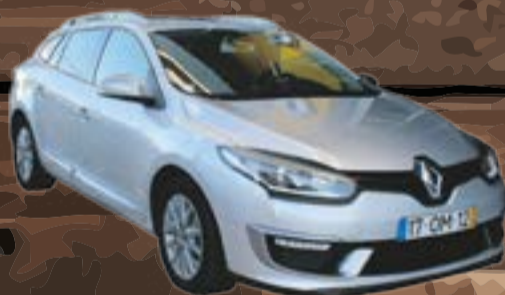
Renault Megane Sport Tourer GT LINE 1.5V DCI 110 CV 2014 19.450,00€