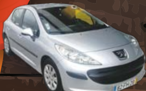
Peugeot 207 Trendy 1.4 16v 95 cv - 2008 7.450,00€