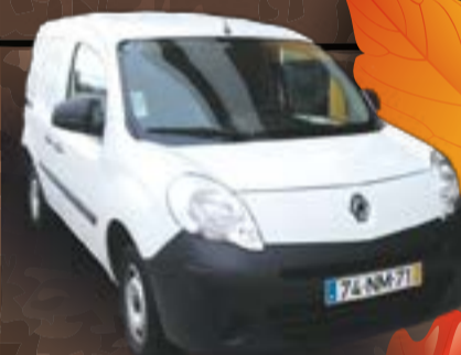
Renault Kangoo PACK CLIM 1.5 DCI 70 CV 2010 5.650,00 + IVA