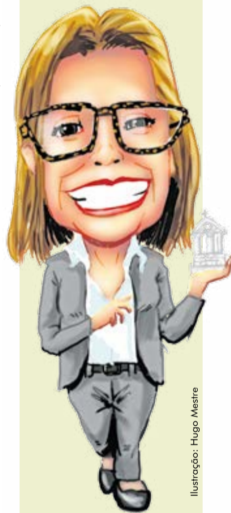
Ilustração: Hugo Mestre