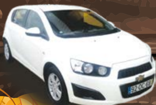
Chevrolet Aveo 1.2 Bi-Fuel (gasolina/GPL) -2013 9.950,00€