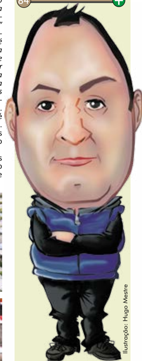
Ilustração: Hugo Mestre