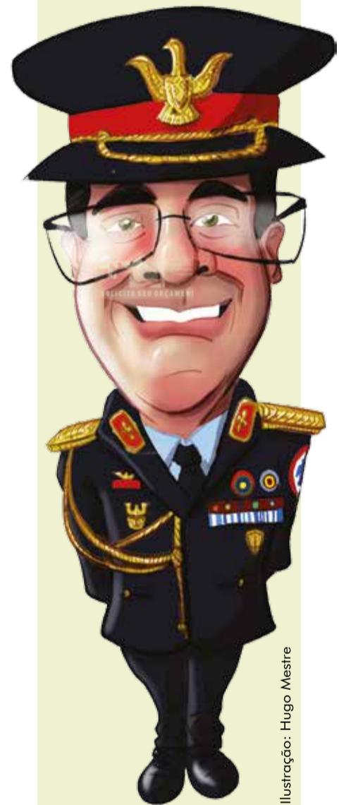
Ilustração: Hugo Mestre