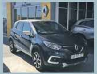
RENAULT Captur EXCLUSIVE 1.5 DCI 110 CV 2017 20.890€