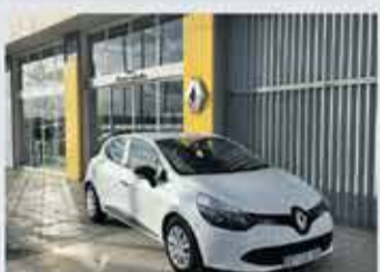
Renault Clio Societe (IVA DEDUTIVEL) 1.5 DCI 75 CV 2013.....13.250€