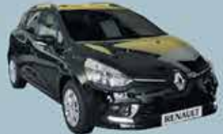
Renault Clio SPORT TOURER LIMITED 1.5 DCI 90 CV 2017 18.990€