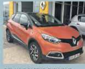
RENAULT CAPTUR EXCLUSIVE 1.5 DCI 90 CV 2017 19.990€