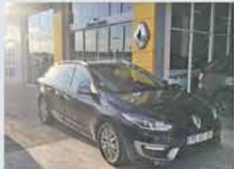
Renault Megane Sport Tourer Gt Line 1.5 dci 110cv 2014.....15.990,00€