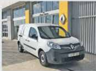
Renault Kangoo Maxi 1.5 dci 90cv 2016...13250,00€ IVA dedutível