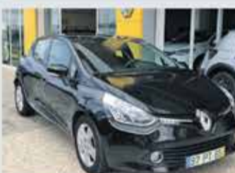
Renault Clio Dynamique S 1.5 dci 90 cv 2015.....15.450€