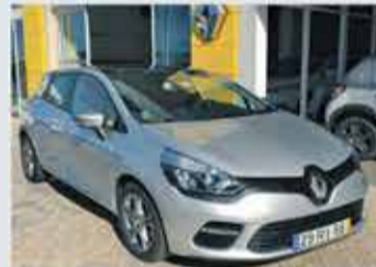
RENAULT CLIO SPORT TOURER GT LINE 1.5 DCI 90 CV 2016.....17.650€