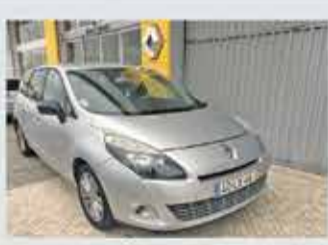
Renault Grand Scenic Dynamite S 1.5 dci 110cv 2011...13.950,00€