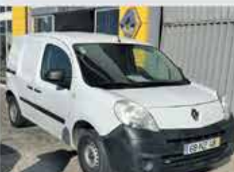
Renault Kangoo Business 1.5 dci 75cv 2013.....8.500,00€ (iva dedutível)