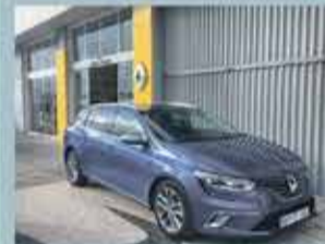
RENAULT Megane Sport Tourer GT Line 1.6 Dci 130 Cv - 2017 29.500€