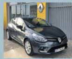
Renault Clio LIMITED 1.5 dci 90 cv 2017 18.790€