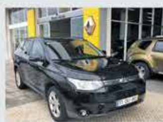
Mitsubishi Outlander 2.2 DID 150cv 7L 2014.....24.450€