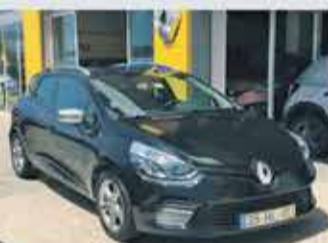
RENAULT CLIO SPORT TOURER GT LINE 1.5 DCI 90 CV 2016.....17.450€