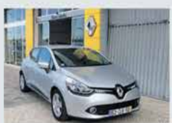
Renault Clio DYNAMIQUE S 1.5 dci 90 cv 2015.....15.490,00€