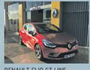
RENAULT CLIO GT LINE 1.5 DCI 90 CV 2017 19.990,00€