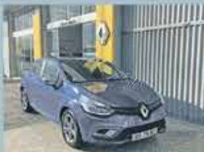
Renault Clio GT LINE 1.5 DCI 90 CV 2017 20.600€