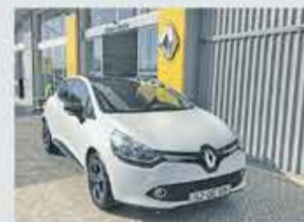
RENAULT CLIO DYNAMIQUE S 1.5 DCI 90 CV 2015.....15.750€