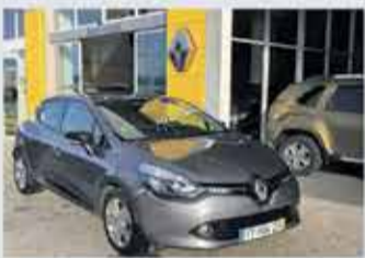
Renault Clio Dynamique 1.5 dci 90cv 2015....15.450€