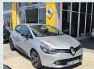
Renault Clio DYNAMIQUE 1.5 dci 90cv 2013....14.750€