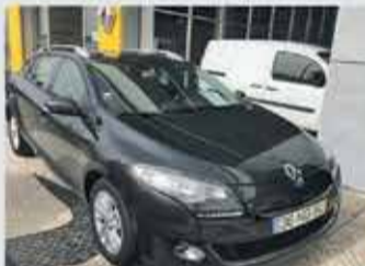
Renault Megane Sport Tourer Dynamique s 1.5 dci 110 cv 2012.....14.450€