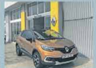
Renault Captur EXCLUSIVE XMOD 1.5 DCI 110 CV 2017 21.890€