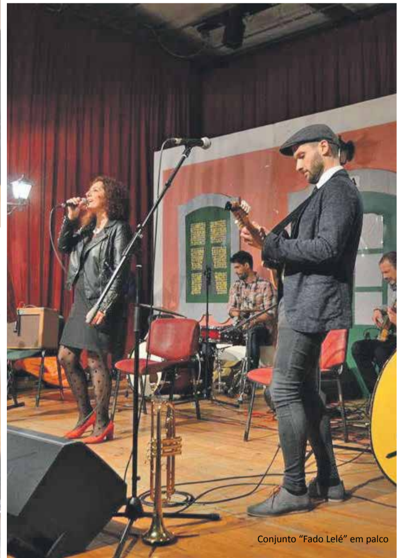
Conjunto "Fado Lelé" em palco

Além dos fados trazidos pelos participantes, a música também reinou por meio dos Fado Lelé, um conjunto que deixou o público absolutamente rendido. A banda trouxe temas por todos conhecidos, como "A Casa da Mariquinhas" ou "Uma Casa Portuguesa", mas também alguns originais seus, e mereceu uma grande ovação. Esta grande noite terminou com a entrega dos diplomas de participação aos concorrentes pelos membros do Júri do Concurso.