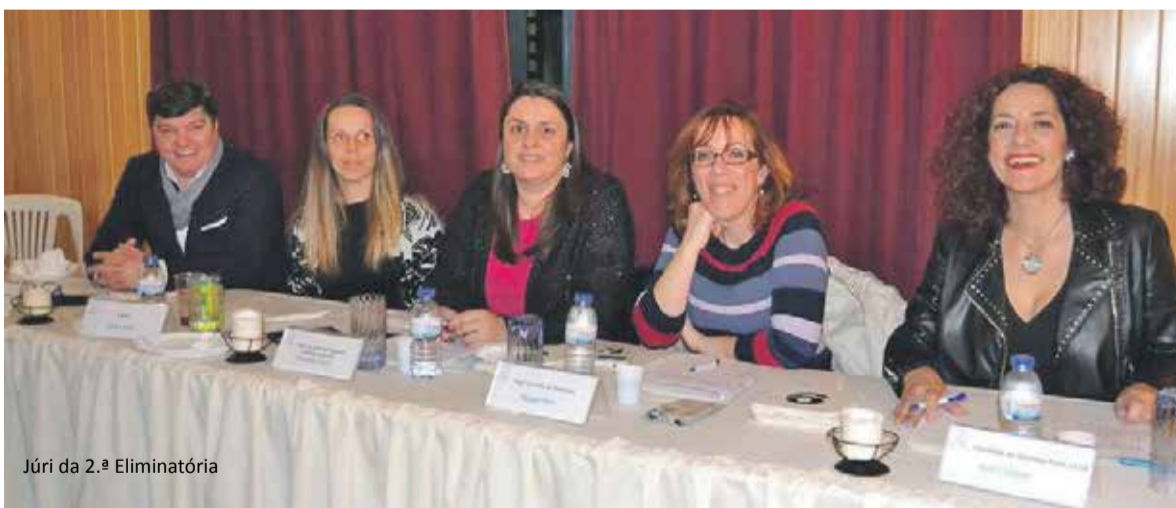
Júri da 2.ª Eliminatória