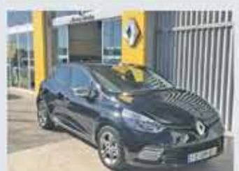
Renault Clio Gt line 1.5 dci 90cv 2015.....16.750€