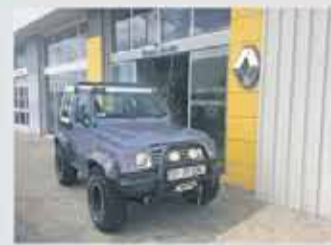
Suzuki Samurai 1.9td (FULL EXtras) 2000 ..... 10.000euros