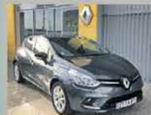
Renault Clio LIMITED 1.5 dci 90 cv 2017 18.790€