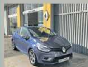
Renault Clio GT LINE 1.5 DCI 90 CV 2017 19.990€