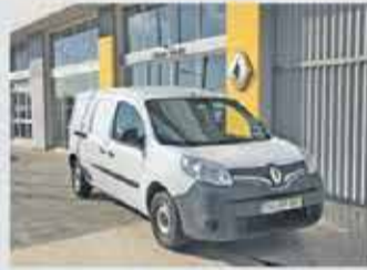
Renault Kangol Maxi 1.5 dci 90cv 2016...12.990,00€ IVA dedutível