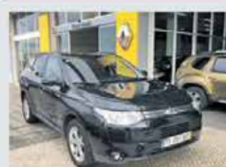
Mitsubishi Outlander 2.2 DID 150cv 7L 2014.....24.450€