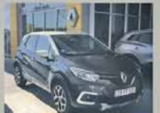
RENAULT Captur EXCLUSIVE 1.5 DCI 110 CV 2017 20.890€