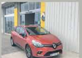
CLIO SPORT TOURER LIMITED DCI 90CV 2017 19.600€