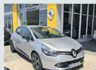
Renault Clio DYNAMIQUE 1.5 dci 90cv 2013....14.750€