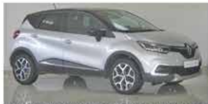
CAPTUR EXCLUSIVE 1.5 DCI 90CV X-MOD - 2018 - 19750€