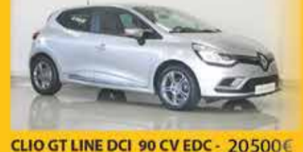
CLIO GT LINE DCI 90 CV EDC - 20500€