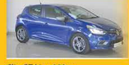
Clio GT Line 110cv 2018 - 20250€