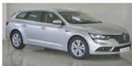
Talisan 1.6dci Itens 130CV EDC 2017 - 25990€