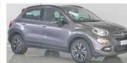
Fiat 500 X 1.3 Multijet start 95cv 2016 - 15900€