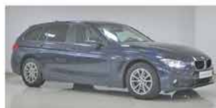
BMW 318 2.0D ADVANTAGE 150CV AUTO - 2016 - 29450€