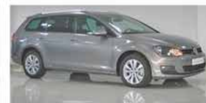
GOLF VARIANT TDI 110CV GPS - 2017 - 20450€