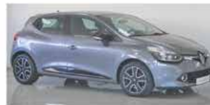
RENAULT CLIO 1.5 DCI DYNAMIQUE S 90 CV - 2015 - 14250€