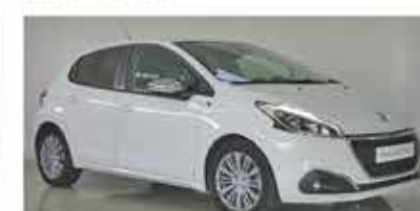
Peugeot 208 1.6 HDI 75CV STYLE - 2016 - 13900€