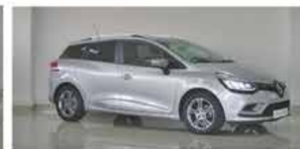
Clio ST GT line 90cv 2018 - 16900€