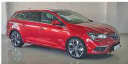
Renaul Megane S.T. Bose 1.6DCI 130 CV EDC (cx Aut.) 2018 24900€