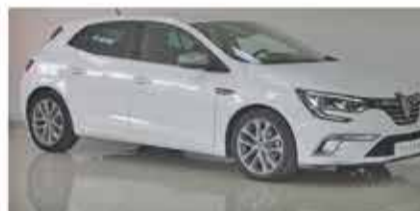
Megane GT line 5p 110 cv 2017 - 19900€