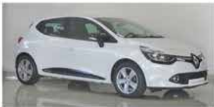
CLIO DYNAMIQUE S 1.5 DCI 90 CV - 2015 - 13500€