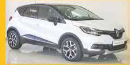
CAPTUR EXCLUSIVE 1.5 DCI 90CV - 2018 - 20900€