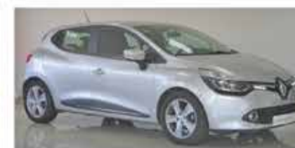
RENAULT CLIO 1.5 DCI DYNAMIQUE S 90 CV - 2015 - 13500€