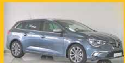
MEGANE IV ST GTLINE 115CV - 2019 - 24750€