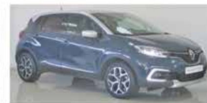
RENAULT CAPTUR 1.5 DCI EXCLUSIVE 110CV - 19900€ - 2018