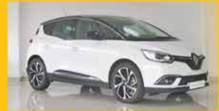
SCÉNIC BOSE EDITION 1.7 DCI 150CV - 2019 - 30500€