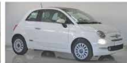
FIAT 500 U-CONNECT 1.2 GPS - 2017 - 12250€