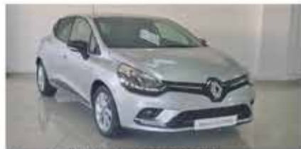
Renault Clio Limited TCE 90CV 2018 - 13990€