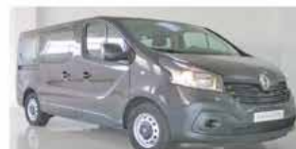
RENAULT TRAFIC 1.6 DCI 125CV 9 LUGARES - 2016 - 22500€