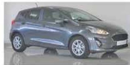
FORD FIESTA 1.0 TI-VCT BUSINESS 85 CV - 2018 - 13900€