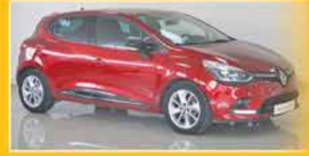
Clio Limited 90 cv 2017- 15750€