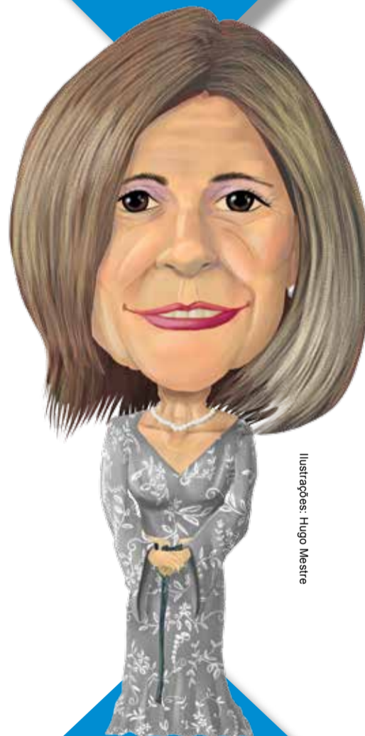
Ilustrações: Hugo Mestre