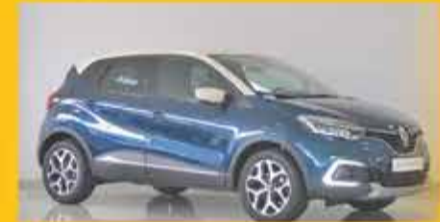
CAPTUR EXCLUSIVE 1.5 DCI 90CV - 2019 - 22700€ - 0KM