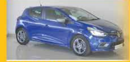
Clio GT Line 110cv 2018 - 20250€