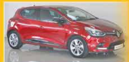
Clio Limited 90 cv 2017- 15750€