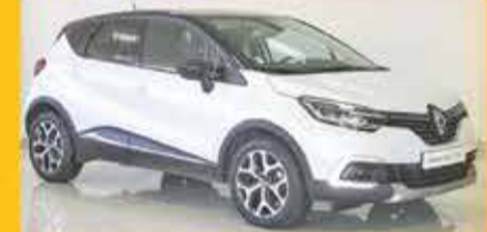
CAPTUR EXCLUSIVE 1.5 DCI 90CV - 2018 - 20900€