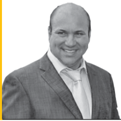
MIRANTE Por Victor Cacito Cronista