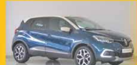
CAPTUR EXCLUSIVE 1.5 DCI 90CV - 2019 - 22700€ - 0KM