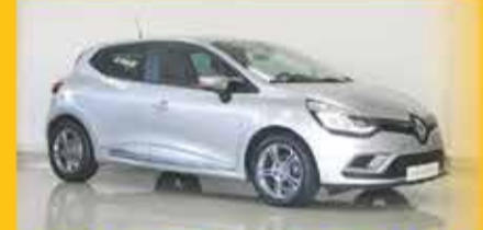
CLIO GT LINE DCI 90 CV EDC - 20500€