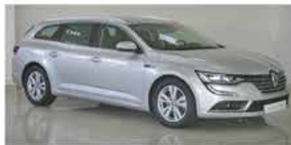
Talisan 1.6dci Itens 130CV EDC 2017 - 25990€