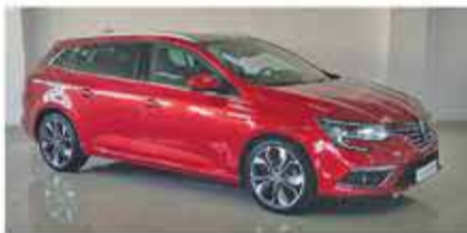
Renault Megane S.T. Bose 1.6DCI 130 CV EDC (cx Aut.) 2018 - 24900€