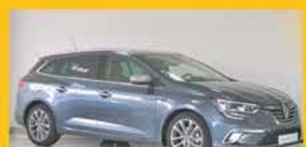
MEGANE IV ST GTLINE 115CV - 2019 - 24750€