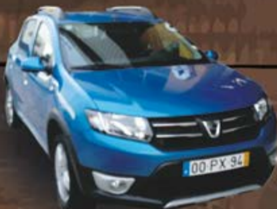
Dacia Sandero STEPWAY 1.5 DCI 90 CV 2015 16500,00€