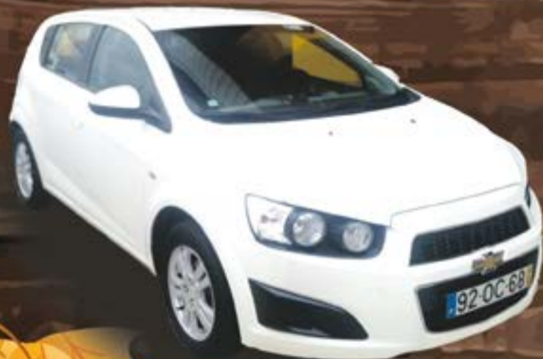
Chevrolet Aveo 1.2 Bi-Fuel (gasolina/GPL) - 2013 9.950,00€