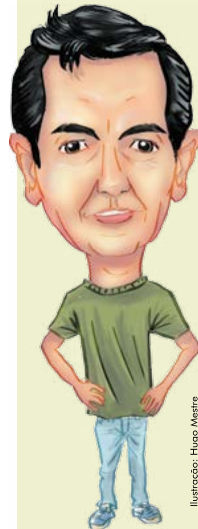
Ilustração: Hugo Mestre