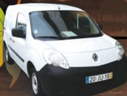
Renault Kangoo BUSINESS 1.5 DCI 75 CV 2013, 8000,00 + IVA