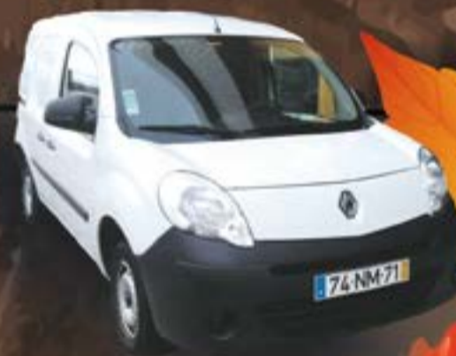
Renault Kangoo PACK CLIM 1.5 DCI 70 CV 2010 5650,00 + IVA