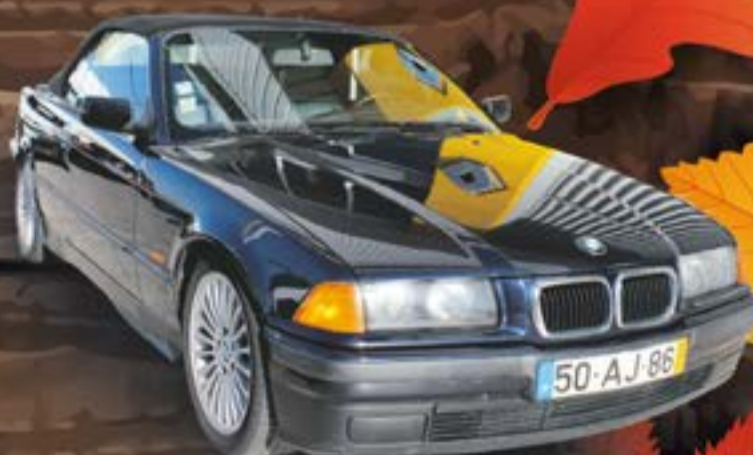
BMW 318 Cabriolet 2000 9950,00€

Telefones: Geral: 219 382 910 Fax: 219 387 235