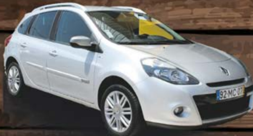
Renault Clio Break Dynamique S 1.5 dci 90 cv - 2011 12.450,00€