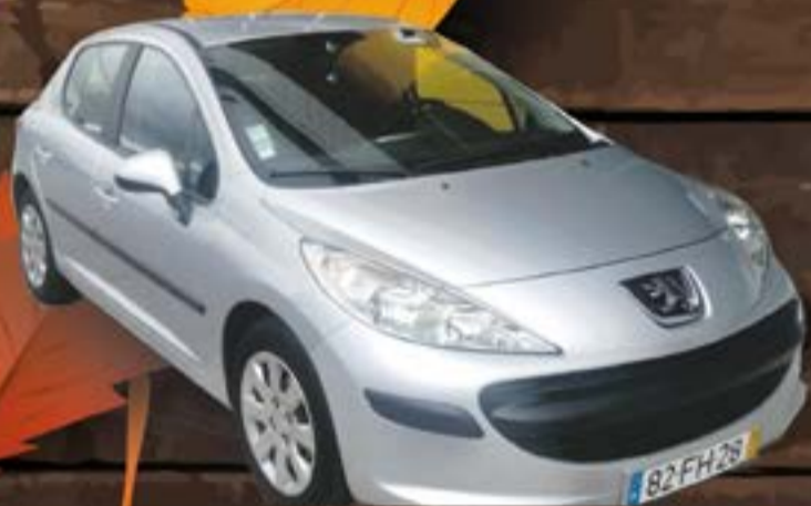
Peugeot 207 Trendy 1.4 16v 95 cv - 2008 7.450,00€