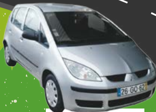
Mitsubishi COLT 1.1 5p 2008 5.450€