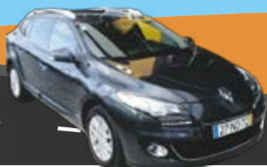
Renault Megane Sport Tourer Dynamique S 1.5 dci 110 cv 2012 15.950€