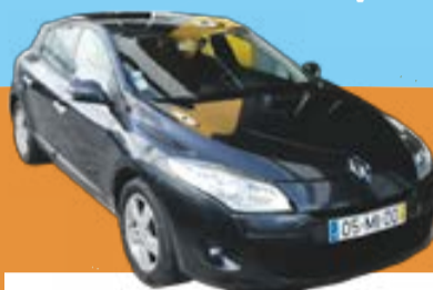
Renault Megane Berlina Dynamique 1.5 dci 110 cv 2011 13.950€