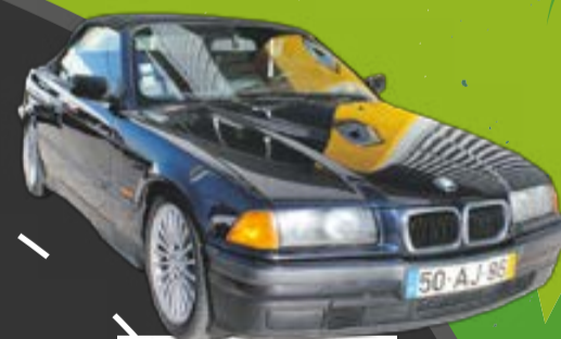
BMW 318 Cabriolet 2000 8.000€

Telefones: Geral: 219 382 910 Fax: 219 387 235