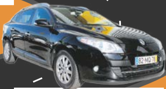
Renault Megane Berlina Dynamique 1.5 dci 110 cv 2011 14.950€