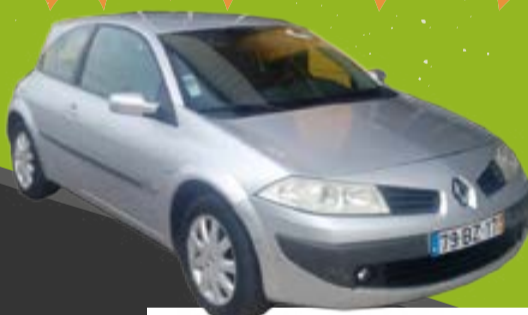
Renault Megane Societé 1.5 dci 105 cv 2006 4.000€ + IVA