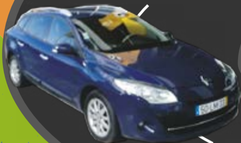
Renault Megane Sport Tourer LUXE 1.5 DCI 110 CV 2011 14.450€