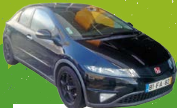
Honda civic Sport 1.8 140 cv 2008 8.950€