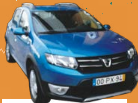
Dacia Sandero STEPWAY 1.5 DCI 90 CV 2015 16.500€