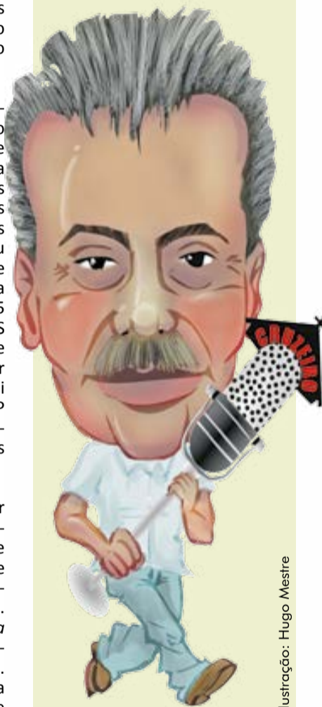
Ilustração: Hugo Mestre