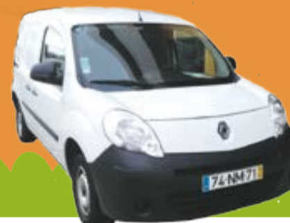
Renault Kangoo PACK CLIM 1.5 DCI 70 CV 2010 5.250€ + IVA