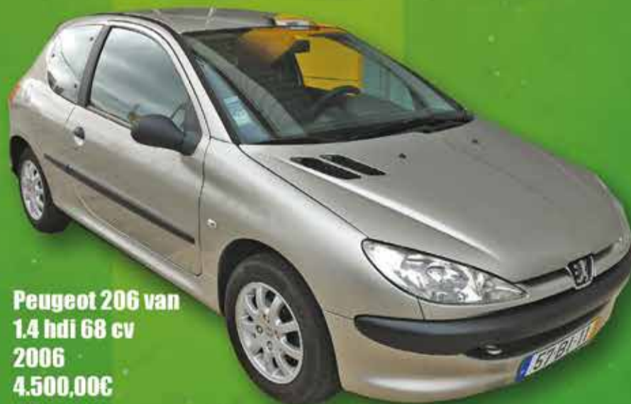
Peugeot 206 van 1.4 hdi 68 cv 2006 4.500,00€