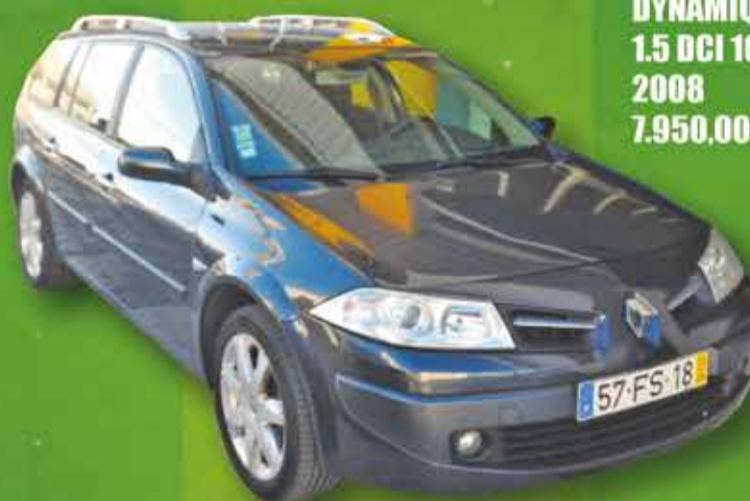
Renault Megane Break DYNAMIQUE S 1.5 DCI 105 CV 2008 7.950,00€