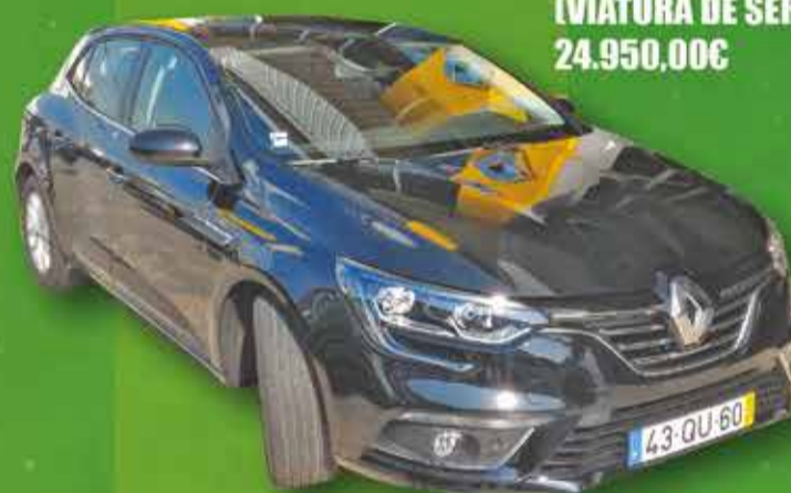
Renault Megane INTENSE 1.5 DCI 110 CV 2016 (VIATURA DE SERVIÇO) 24.950,00€