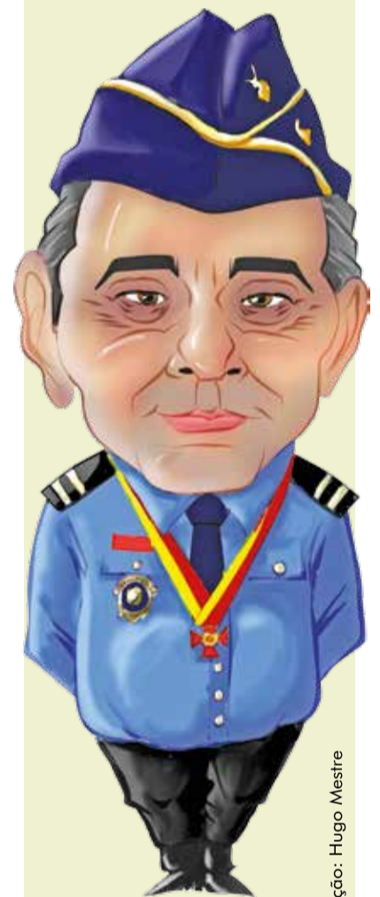
Ilustração: Hugo Mestre