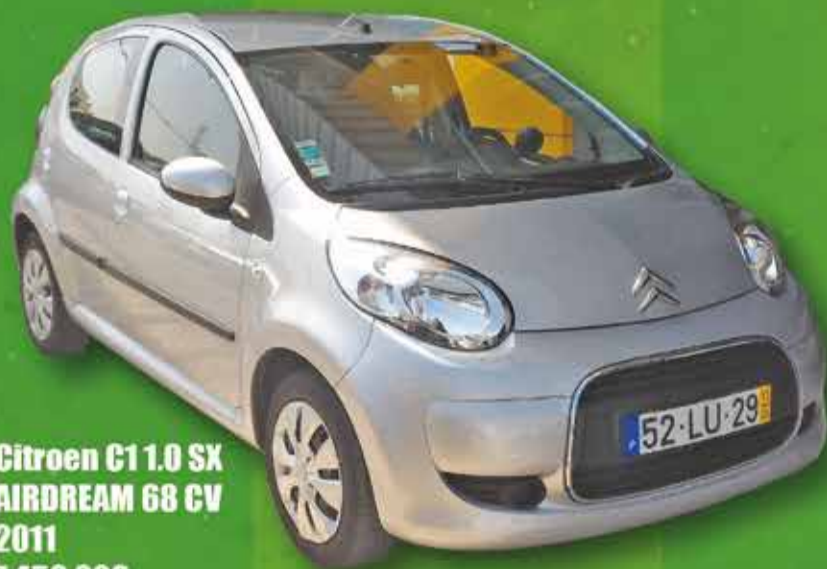
Citroen C1 1.0 SX AIRDREAM 68 CV 2011 7.450,00€