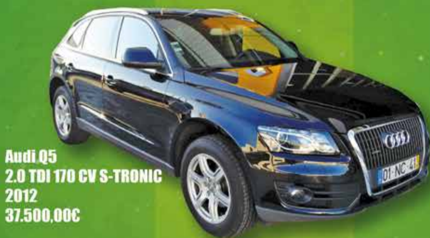
Audi Q5 2.0 TDI 170 CV S-TRONIC 2012 37.500,00€