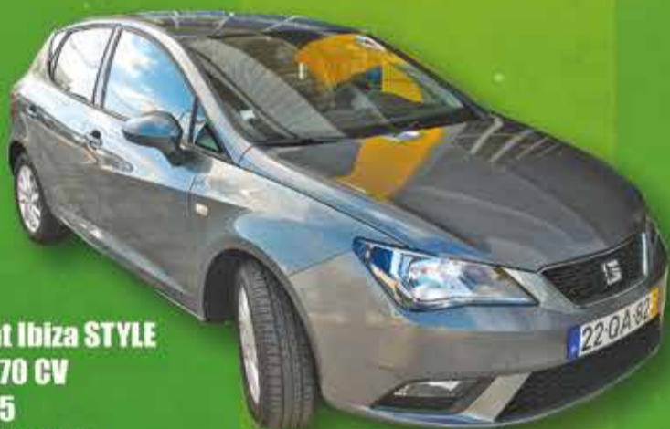
Seat Ibiza STYLE 1.2 70 CV 2015 11.950,00€