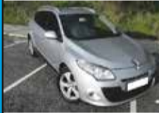
Renault Megane 1.5 dCi Dyn.S 13.900,00€