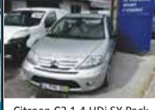
Citroen C3 1.4 HDi SX Pack (70cv) (5p) 7.250,00€