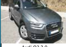
Audi Q3 2.0 TDi 137g 29.500,00 €