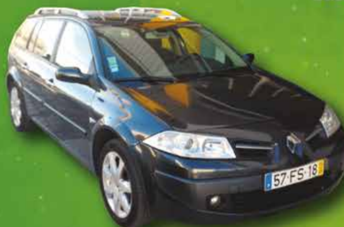
Renault Megane Break DYNAMIQUE S 1.5 DCI 105 CV 2008 7.950,00€