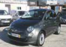
Fiat 500 1.2 16V Lounge 11.800,00€