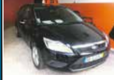
Ford Focus 1600 Tdci 2011 13.950,00€