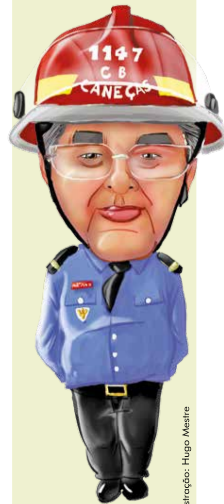
Ilustração: Hugo Mestre