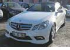
Mercedes Benz E 250 CDI CABRIO 36.800,00€