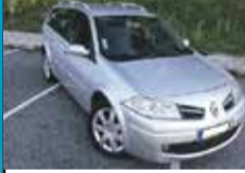
Renault Megane 1.5 dCi Dynamique S 7.250,00€