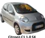
Citroen C1 1.0 SX AIRDREAM 68 CV 2011 7.450,00€