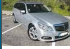
Mercedes Benz E 350 CDi Avantgarde 29.990,00€