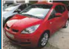
Mitsubishi Colt CZP 150cv 2004 7.950,00€