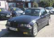
BMW (Série 3) 318 i cabriolet 5.800,00€