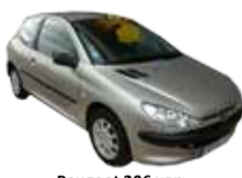
Peugeot 206 van 1.4 hdi 68 cv 2006 4.500,00€