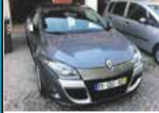
Renault Megane Coupé 2010 15.950,00€