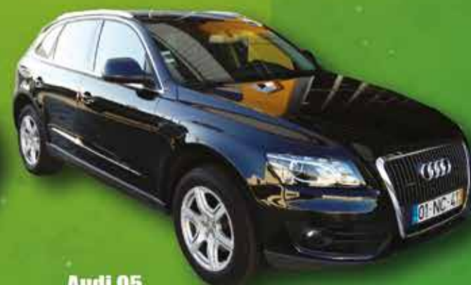
Audi Q5 2.0 TDI 170 CV S-TRONIC 2012 37.500,00€