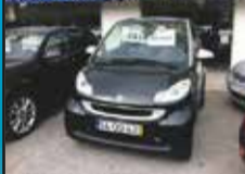
Smart cdi 2007 7.250,00€