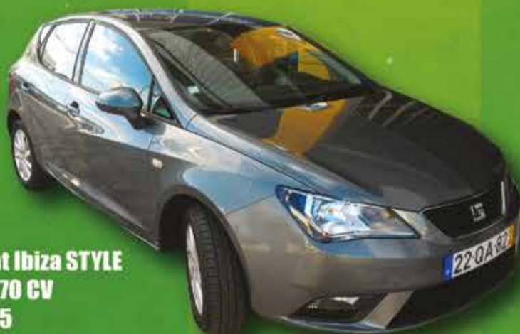
Seat Ibiza STYLE 1.2 70 CV 2015 11.950,00€