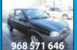
968 571 646 Opel Corsa 2000TD dir. ass. 163.200Km só 1 dono 1.500€