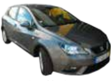
Seat Ibiza STYLE 1.2 70 CV 2015 11.950,00€