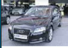
Audi A3 SPORT S.LINE 17.850,00€