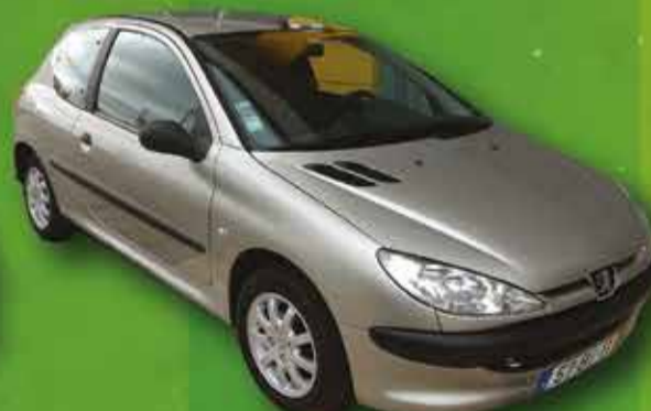
Peugeot 206 van 1.4 hdi 68 cv 2006 4.500,00€