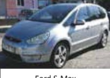
Ford S-Max TITANIUM 15.800,00€