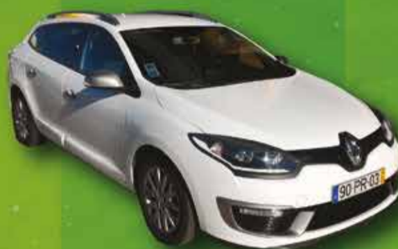
Renault Megane Sport Tourer GT LINE 1.5 dci 110 cv 2015 20.950,00€