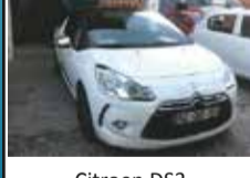
Citroen DS3 1.6HDi 2012 16.950,00€