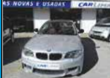
BMW Série 1 123 dA (204cv) (2p) 21.500,00€