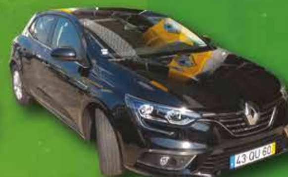
Renault Megane INTENSE 1.5 DCI 110 CV 2016 (VIATURA DE SERVIÇO) 24.950,00€