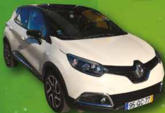
Renault Captur EXCLUSIVE 1.5 dci 90 cv (CX AUTOMÁTICA) 2015 19.950,00€