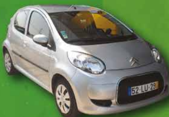
Citroen C1 1.0 SX AIRDREAM 68 CV 2011 7.450,00€