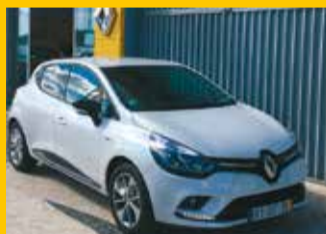
RENAULT CLIO LIMITED TCE 90 CV 2016.....15.250,00€