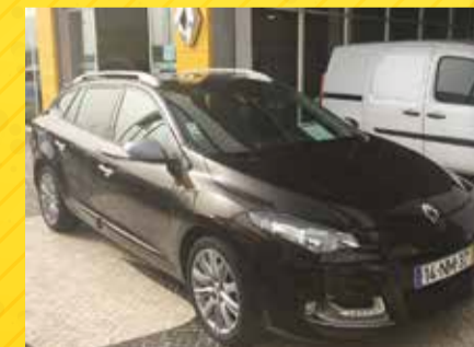
RENAULT MEGANE SPORT TOURER GT LINE 1.6 DCI 130 CV 2013..... 17.990,00€