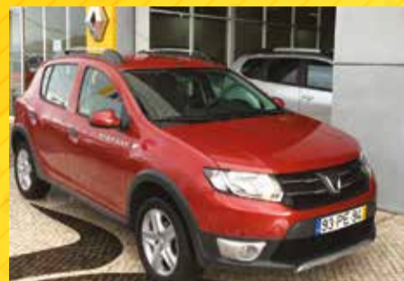
DACIA SANDERO STEPWAY 1.5 DCI 90 CV 2014..... 13.950,00€