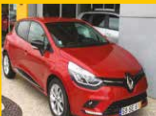
RENAULT CLIO LIMITED 1.5 DCI 90 CV 2016.....19.000,00€