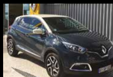
RENAULT CAPTUR EXCLUSIVE 1.5 DCI 110 CV CX6V 2016..... 21.000,00€