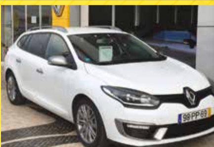
RENAULT MEGANE SPORT TOURER GT LINE 1.5 DCI 110 (CX AUT.) 2015..... 20.750,00€