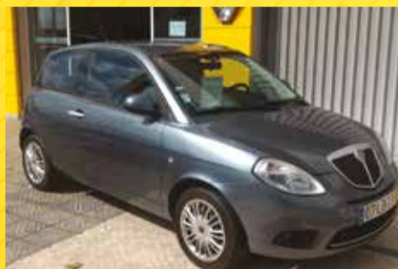
LANCIA YPSILON 1.2 16V 60 CV 2010..... 7.450,00€