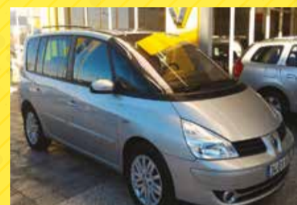
RENAULT ESPACE 2.0 DCI 175 CV 2006..... 13.950,00€