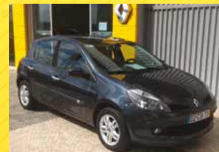
RENAULT CLIO DYNAMIQUE 1.2 16V 75 CV 2006..... 5.500,00€