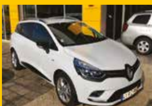
RENAULT CLIO SPORT TOURER LIMITED 1.5 DCI 90 CV 2016.....19.250,00€