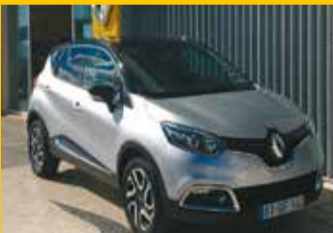
RENAULT CAPTUR EXCLUSIVE 1.5 DCI 90 CV 2016.....21.000,00