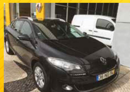
RENAULT MEGANE SPORT TOURER DYNAMIQUE S 1.5 DCI 110 CV 2012..... 15.450,00€