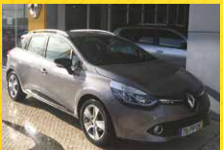
RENAULT CLIO SPORT TOURER DYNAMIQUE S TCE 90 CV - 2015..... 13.990,00€