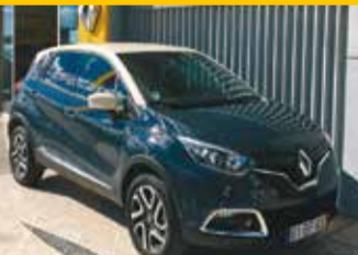
RENAULT CAPTUR EXCLUSIVE 1.50DCI 110 CV CX6V 2016.....21.000,00€