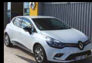
RENAULT CLIO LIMITED TCE 90 CV 2016..... 15.250,00€