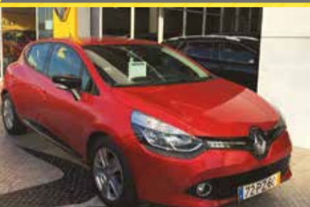
RENAULT CLIO DYNAMIQUE S 1.5 DCI 90 CV 2015..... 15.750,00€