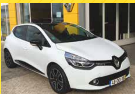
RENAULT CLIO DYNAMIQUE S 1.5 DCI 90 CV 2015..... 16.450,00€