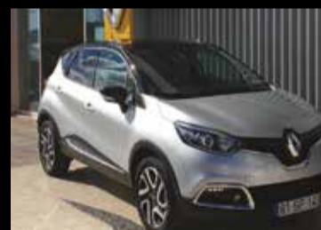
RENAULT CAPTUR EXCLUSIVE 1.5 DCI 90 CV 2016..... 21.000,00