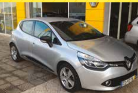
RENAULT CLIO DYNAMIQUE S 1.5 DCI 90 CV 2015..... 14.750,00€