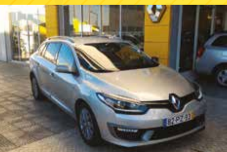
RENAULT MEGANE SPORT TOURER GT LINE 1.5 DCI 110 CV 2015..... 19.750,00€