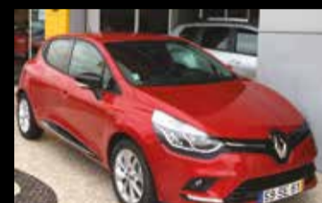
RENAULT CLIO LIMITED 1.5 DCI 90 CV 2016..... 19.000,00€