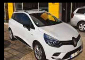
RENAULT CLIO SPORT TOURER LIMITED 1.5 DCI 90 CV 2016... 19.250,00€