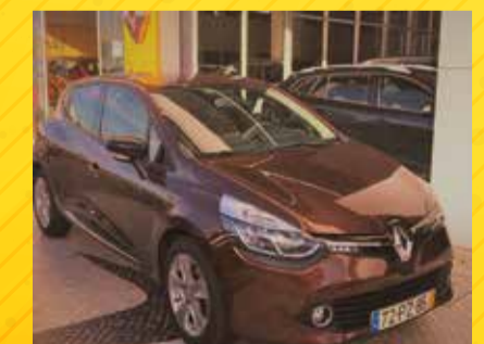
RENAULT CLIO DYNAMIQUE S 1.5 DCI 90 CV 2015..... 15.750,00€