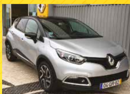
RENAULT CAPTUR EXCLUSIVE TCE 90 CV 2015..... 15.450,00€