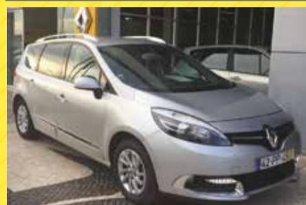
RENAULT GRAND SCÉNIC DYNAMIQUE S 1.5 DCI 110 CV 2015..... 19.990,00€