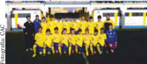
Departamento de Futebol do CAC

deixar uma mensagem a todos os presentes de um santo e feliz Natal.