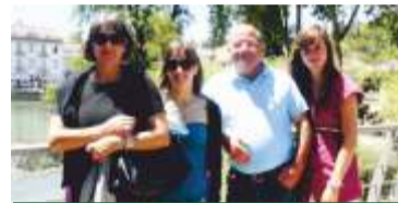
Com a Esposa e Filhas