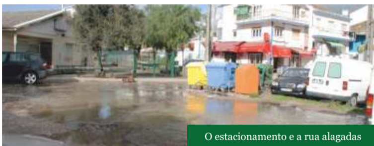
O estacionamento e a rua alagadas