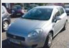
FIAT PUNTO 1.3 M-JET DIESEL POUCOS KMS 8.800€