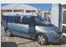
RENAULT ESPACE 7 lugares 1.9 DCI 12 CV 2009 16.000€ veículo de serviço