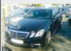
MERCEDES BENZ E250 CDI AMG 35800€