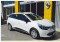
RENAULT CLIO SPORT TOURER - 2013 diesel, AC, 18.000€ veículo de serviço