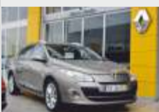
RENAULT MÉG. SPORT TOURER DYNAM.S - 2010 J.L.L. 17" AC gasóleo 16.750€