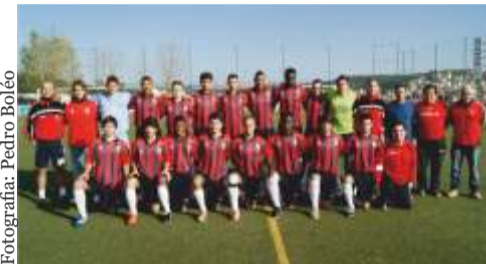
Fotografia: Pedro Boléo