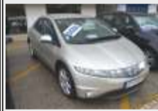
HONDA CIVIC 2.2 SPORT CDTI 2008 - 140.000KM 13.950€