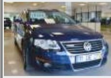
VW PASSAT VARIANT 1.9 TDI BLUEMOTION 2008 - 125.000KM 16.500€