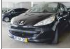
PEUGEOT 207 1.4 HDI 2008 - 97.000 KM 9.250€