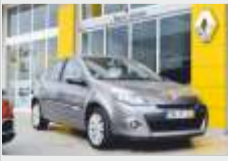
RENAULT CLIO DYNAM. 1.2 16V - 2010 gasolina AC 8.500€