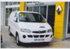
HYUNDAI H1 3L 2003 gasóleo 4.750€