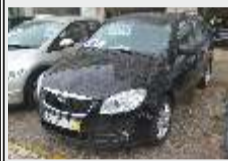
SKODA FABIA BREAK SPORT 1.4 TDI 2008 - 140.000KM 9.490€