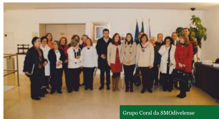
Grupo Coral da SMOdivelense

E, como não podia deixar de ser, em Dia de Reis, o evento terminou com vinho do Porto e... Bolo Rei!.