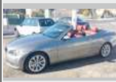
BMW 330 D CABRIO COMO NOVO 31800€