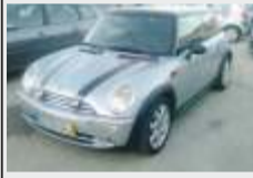
MINI ONE D POUCOS KMS 10.800€