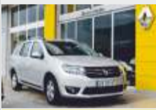
DACIA LOGAN 1500 DCI 90 cavalos veículo de serviço 17.000€