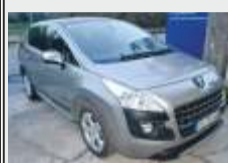
PEUGEOT 3008 12 2009 - 128.500KM 18.000€