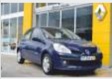
RENAULT CLIO CONFORT DYNAM - 1.2 16V 75 CV 6.500€