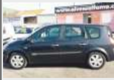
RENAULT GRAND SCENIC 1.5 DCi 7 LUGARES BOM PREÇO