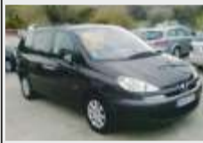
PEUGEOT 807 2.2 HDi 7 LUGARES PELE / GPS