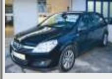
OPEL ASTRACOSMO 1.7 CDTI 2009 13.950€