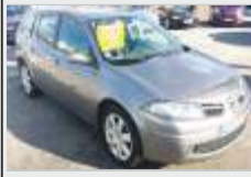
RENAULT MEGANE BREAK 1.5 DCi 12.800€