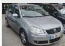
VOLKSWAGEN POLO 1.4 TDI 2008 - confort line 10.250€