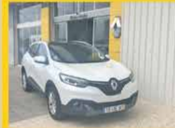
RENAULT Kadjar Excluív 1.5dci 110cv 2018 29,500€