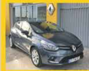
Renault Clio LIMITED 1.5 dci 90 cv 2017 18.790€