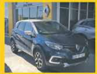
RENAULT Captur EXCLUSIVE 1.5 DCI 110 CV 2017 20.890€