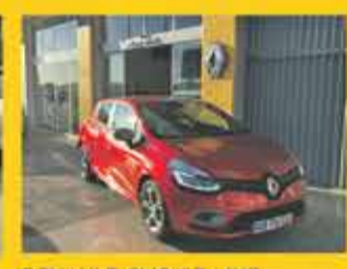
RENAULT CLIO GT LINE 1.5 DCI 90 CV 2017 19.990,00€