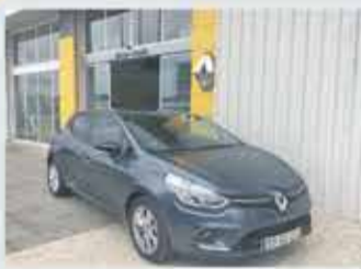
Renault Clio limited Tce 90cv 2017.....14990€