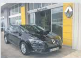
Renault Megane sport tourer Intense 1.5DCI 110cv 2017.... 24,450€