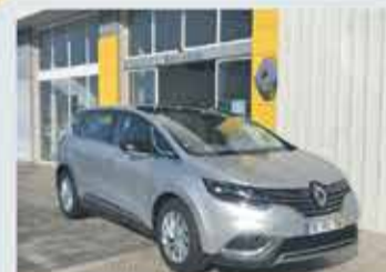
Renault Espace 1.6 dci 130 CV ZEN 2016..... 29.750€