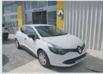
RENAULT Clio Societe 1.5 dci 75cv 2016.....14,990€ (IVA dedutível)