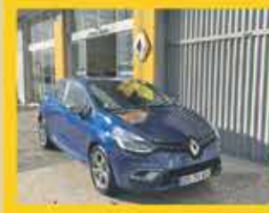
Renault Clio GT LINE 1.5 DCI 90 CV 2017 19.990€