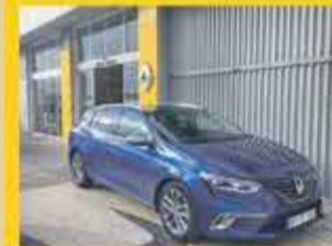
RENAULT Megane Sport Tourer GT Line 1.6 Dci 130 Cv - 2017 28.900€