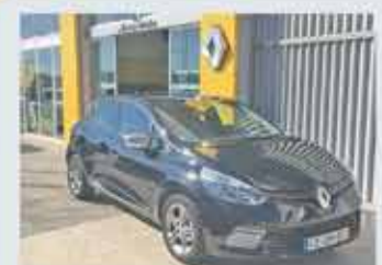
Renault Clio Gt line 1.5 dci 90cv 2015.....16.750€