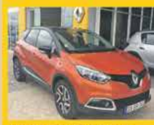
RENAULT CAPTUR EXCLUSIVE 1.5 DCI 90 CV 2017 19.990€