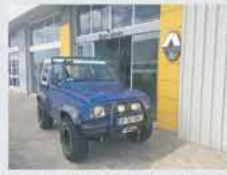
Suzuki Samurai 1.9td (FULL EXtras) 2000 ..... 10.000euros