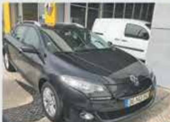
Renault Megane Sport Tourer Dynamique s 1.5 dci 110 cv 2012.....13.750€