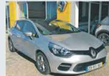
RENAULT CLIO SPORT TOURER GT LINE 1.5 DCI 90 CV 2016.....16.990€