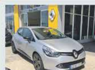
Renault Clio DYNAMIQUE 1.5 dci 90cv 2013....14.750€