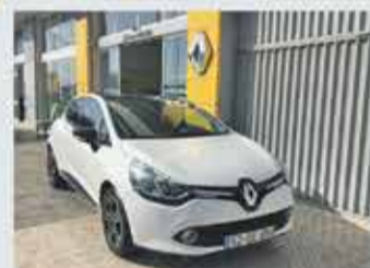
RENAULT CLIO DYNAMIQUE S 1.5 DCI 90 CV 2015.....15.350€