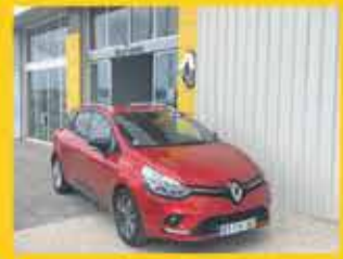
CLIO SPORT TOURER LIMITED DCI 90CV 2017 19.600€