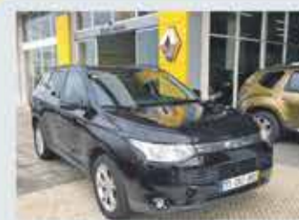
Mitsubishi Outlander 2.2 DID 150cv 7L 2014.....24.450€