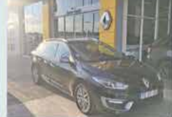
Renault Megane Sport Tourer Gt Line 1.5 dci 110cv 2014.....15.990,00€