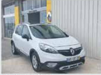
RENAULT SCENIC XMOD 1.6 DCI 130 CV 2013..... 19.250,00€