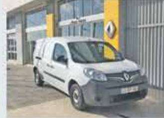
Renault Kangoo Maxi 1.5 dci 90cv 2016...12.990,00€ IVA dedutível