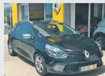
RENAULT CLIO SPORT TOURER GT LINE 1.5 DCI 90 CV 2016.....16.990€