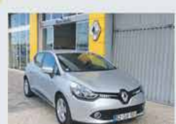
Renault Clio DYNAMIQUE S 1.5 dci 90 cv 2015.....14.990,00€