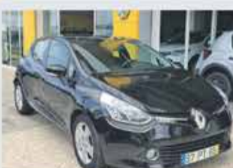
Renault Clio Dynamique S 1.5 dci 90 cv 2015.....14.990€