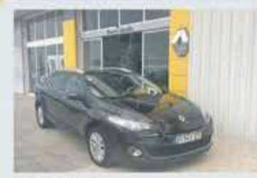
RENAULT Megane sport tourer luxe 1.5 dci 110cv 2012.....15,250€