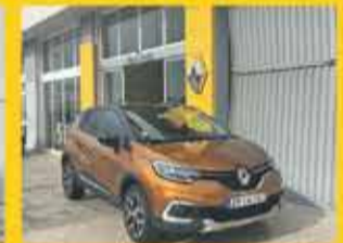
Renault Captur EXCLUSIVE XMOD 1.5 DCI 110 CV 2017 21.890€