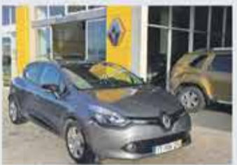
Renault Clio Dynamique 1.5 dci 90cv 2015....14.990€