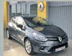
Renault Clio LIMITED 1.5 dci 90 cv 2017 18.790€