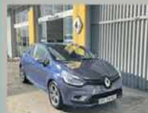
Renault Clio GT LINE 1.5 DCI 90 CV 2017 19.990€