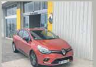
CLIO SPORT TOURER LIMITED DCI 90CV 2017 19.600€