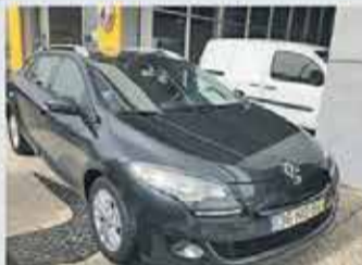
Renault Megane Sport Tourer Dynamique s 1.5 dci 110 cv 2012.....13.750€