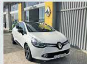
RENAULT CLIO DYNAMIQUE S 1.5 DCI 90 CV 2015.....15.350€