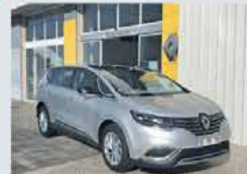
Renault Espace 1.6 dci 130 CV ZEN 2016..... 29.750€