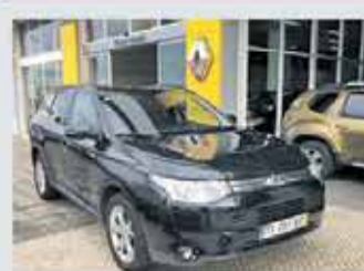
Mitsubishi Outlander 2.2 DID 150cv 7L 2014.....24.450€