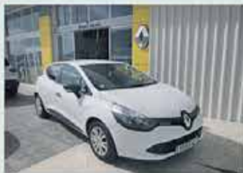
RENAULT Clio Societe 1.5 dci 75cv 2016.....14,990€ (IVA dedutível)