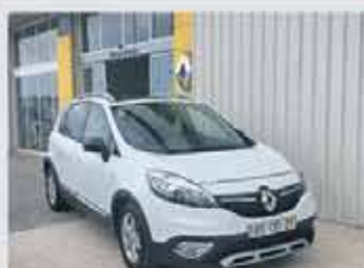
RENAULT SCENIC XMOD 1.6 DCI 130 CV 2013.... 19.250,00€