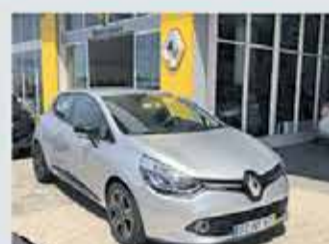
Renault Clio DYNAMIQUE 1.5 dci 90cv 2013....14.750€