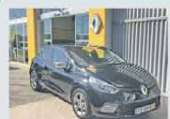
Renault Clio Gt line 1.5 dci 90cv 2015....16.750€