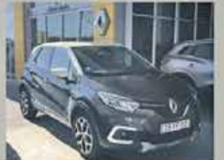
RENAULT Captur EXCLUSIVE 1.5 DCI 110 CV 2017 20.890€