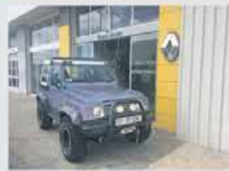
Suzuki Samurai 1.9td (FULL EXtras) 2000 ..... 10.000euros