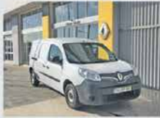
Renault Kangol Maxi 1.5 dci 90cv 2016...12.990,00€ IVA dedutível