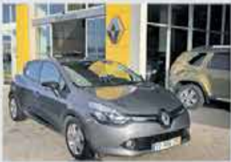
Renault Clio Dynamique 1.5 dci 90cv 2015....14.990€