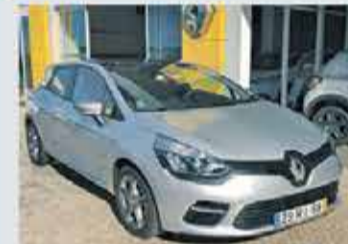
RENAULT CLIO SPORT TOURER GT LINE 1.5 DCI 90 CV 2016.....16.990€