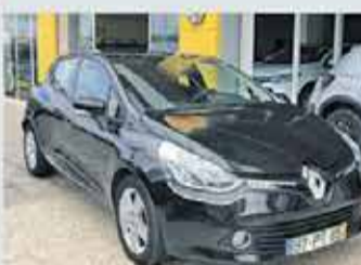
Renault Clio Dynamique S 1.5 dci 90 cv 2015.....14.990€