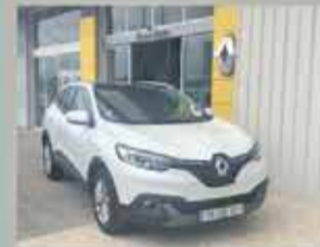
RENAULT Kadjar Excluív 1.5dci 110cv 2018 29,500€