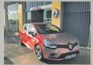
RENAULT CLIO GT LINE 1.5 DCI 90 CV 2017 19.990,00€