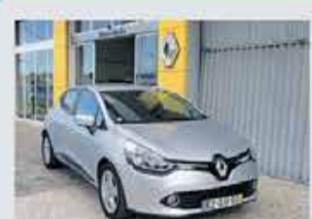
Renault Clio DYNAMIQUE S 1.5 dci 90 cv 2015.....14.990,00€