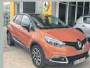
RENAULT CAPTUR EXCLUSIVE 1.5 DCI 90 CV 2017 19.990€