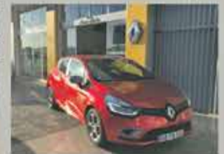
RENAULT CLIO GT LINE 1.5 DCI 90 CV 2017 19.990,00€