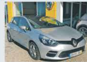
RENAULT CLIO SPORT TOURER GT LINE 1.5 DCI 90 CV 2016.....16.990€