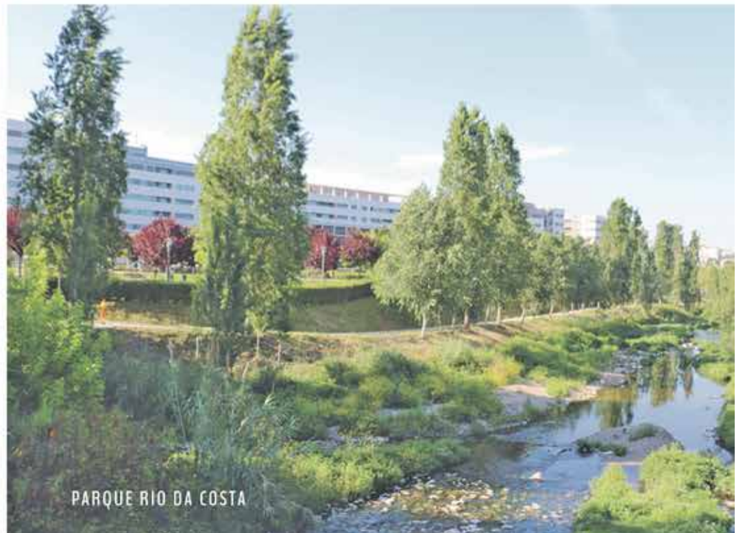
PARQUE RIO DA COSTA