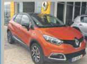
RENAULT CAPTUR EXCLUSIVE 1.5 DCI 90 CV 2017 19.990€