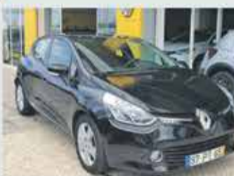
Renault Clio Dynamique S 1.5 dci 90 cv 2015.....14.990€