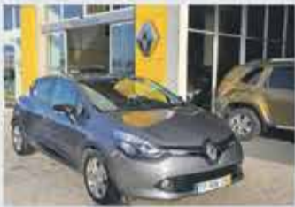
Renault Clio Dynamique 1.5 dci 90cv 2015....14.990€