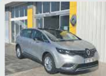
Renault Espace 1.6 dci 130 CV ZEN 2016..... 29.750€