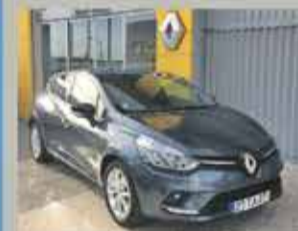
Renault Clio LIMITED 1.5 dci 90 cv 2017 18.790€