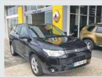
Mitsubishi Outlander 2.2 DID 150cv 7L 2014.....24.450€