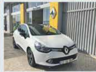
RENAULT CLIO DYNAMIQUE S 1.5 DCI 90 CV 2015.....15.350€