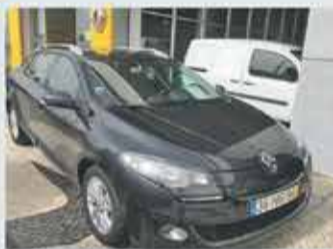
Renault Megane Sport Tourer Dynamique s 1.5 dci 110 cv 2012.....13.750€