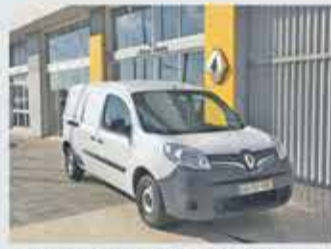
Renault Kangol Maxi 1.5 dci 90cv 2016...12.990,00€ IVA dedutível