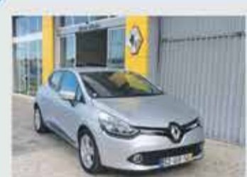
Renault Clio DYNAMIQUE S 1.5 dci 90 cv 2015.....14.990,00€