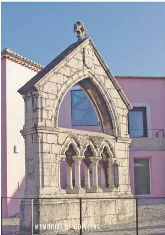
MEMORIAL DE ODIVELAS