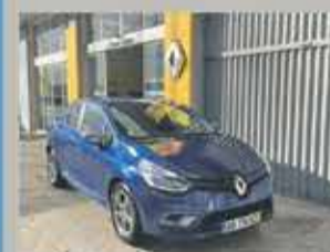
Renault Clio GT LINE 1.5 DCI 90 CV 2017 19.990€