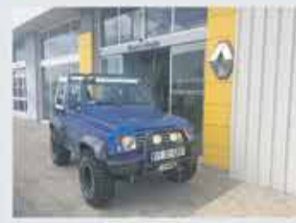
Suzuki Samurai 1.9td (FULL EXtras) 2000 ..... 10.000euros