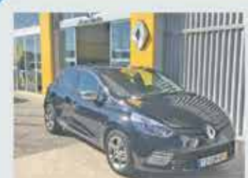
Renault Clio Gt line 1.5 dci 90cv 2015....16.750€