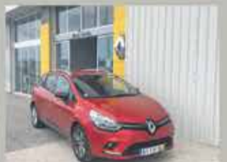
CLIO SPORT TOURER LIMITED DCI 90CV 2017 19.600€