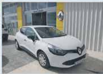
RENAULT Clio Societe 1.5 dci 75cv 2016.....14,990€ (IVA dedutível)