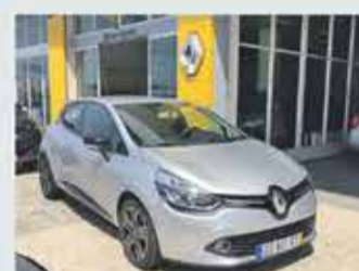
Renault Clio DYNAMIQUE 1.5 dci 90cv 2013....14.750€