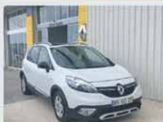
RENAULT SCENIC XMOD 1.6 DCI 130 CV 2013.... 19.250,00€