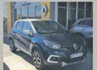
RENAULT Captur EXCLUSIVE 1.5 DCI 110 CV 2017 20.890€