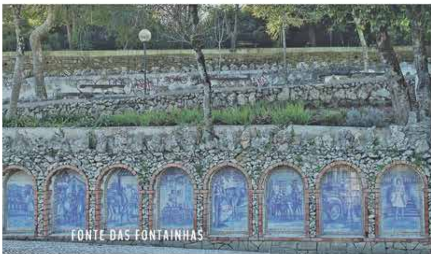
FONTE DAS FONTAINHAS