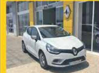
Renault Clio Gt line 1.5 dci 90cv 2018 21.600€