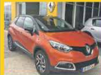
RENAULT CAPTUR EXCLUSIVE 1.5 DCI 90 CV 2017 19.500€