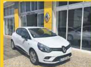
Renault Clio Limited TCE 90 CV 2018 15.500€