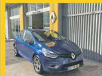
Renault Clio GT LINE 1.5 DCI 90 CV 2017 19.000€