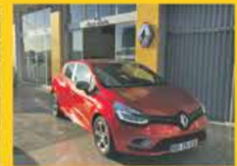
RENAULT CLIO GT LINE 1.5 DCI 90 CV 2017 19.000€