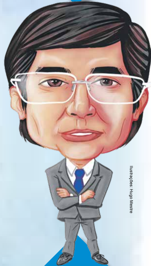
Ilustrações: Hugo Mestre