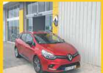
CLIO SPORT TOURER LIMITED DCI 90CV 2017 18.990€