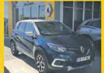
RENAULT Captur EXCLUSIVE 1.5 DCI 110 CV 2017 20.000€