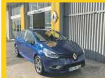
Renault Clio GT LINE 1.5 DCI 90 CV 2017 19.000€