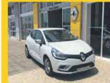
Renault Clio Gt line 1.5 dci 90cv 2018 21.600€