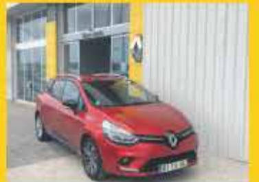
CLIO SPORT TOURER LIMITED DCI 90CV 2017 18.990€