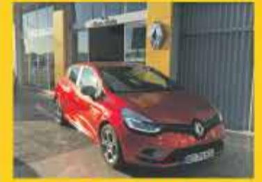
RENAULT CLIO GT LINE 1.5 DCI 90 CV 2017 19.000€