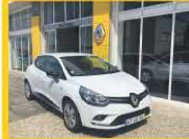
Renault Clio Limited TCE 90 CV 2018 15.300€