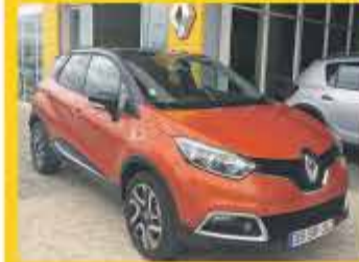
RENAULT CAPTUR EXCLUSIVE 1.5 DCI 90 CV 2017 19.500€