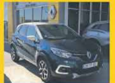
RENAULT Captur EXCLUSIVE 1.5 DCI 110 CV 2017 20.000€