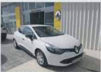
RENAULT Clio Societe 1.5 dci 75cv 2016.....14.990€ (IVA dedutivel)