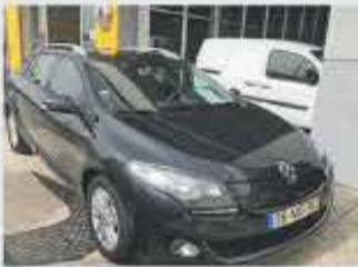
Renault Megane Sport Tourer Dynamique s 1.5 dci 110 cv 2012.....13.750€