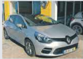
RENAULT CLIO SPORT TOURER GT LINE 1.5 DCI 90 CV 2016.....16.990€