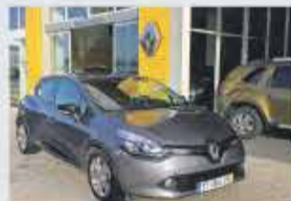
Renault Clio Dynamique 1.5 dci 90cv 2015....14.990€