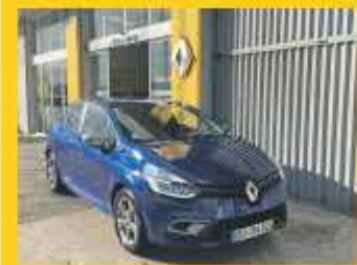
Renault Clio GT LINE 1.5 DCI 90 CV 2017 19.000€