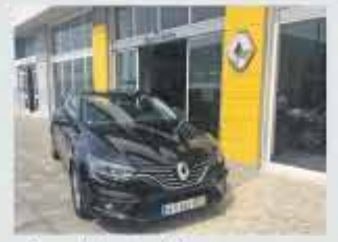
Renaut Megane Intense 1.5 dci 110cv 2016 - 18.500€