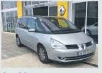
Renault Espace 2.0 175cv 2006 - 10490€