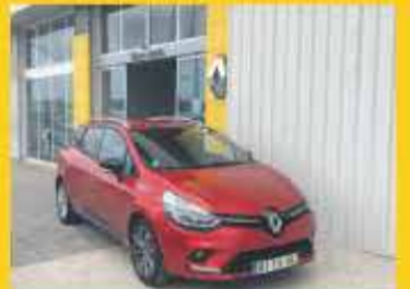
CLIO SPORT TOURER LIMITED DCI 90CV 2017 18.990€