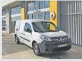
Renault Kangol Maxi 1.5 dci 90cv 2016...12.990,00€ IVA dedutível