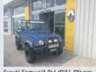
Suzuki Samurai 1.9td (FULL Extras) 2000 ..... 10.000euros