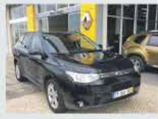
Mitsubishi Outlander 2.2 DID 150cv 7L 2014....22.250€