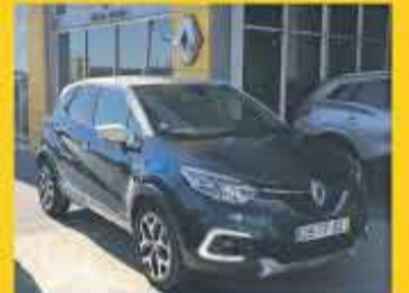
RENAULT Captur EXCLUSIVE 1.5 DCI 110 CV 2017 20.000€