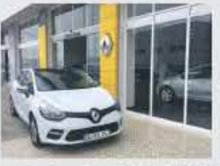
Renault Sport Tourer Gtline 1.5dci 90cv 2016....16.990€