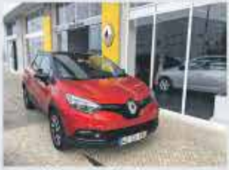
Renault Captur Exclusiv 1.5dci 90cv 2017- 18.990 euros