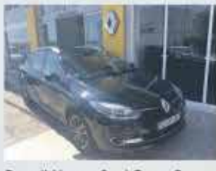
Renault Megane Sport Tourer Base Edition 1.5dci 110cv - 2014 - 17.250€