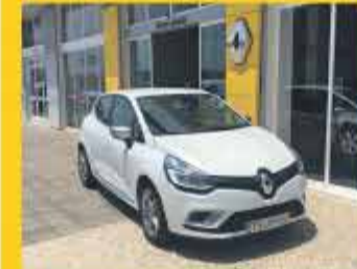
Renault Clio Gt line 1.5 dci 90cv 2018 21.600€