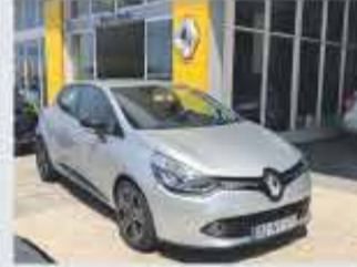
Renault Clio DYNAMIQUE 1.5 dci 90cv 2013...14.750€