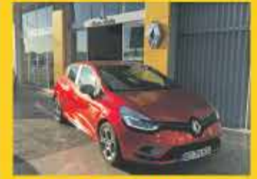
RENAULT CLIO GT LINE 1.5 DCI 90 CV 2017 19.000€