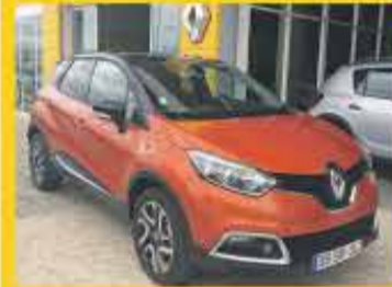
RENAULT CAPTUR EXCLUSIVE 1.5 DCI 90 CV 2017 19.500€