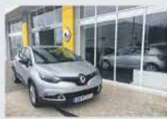
RenaultCaptur Sport 1.5dci 90cv 2015- 15.990 €