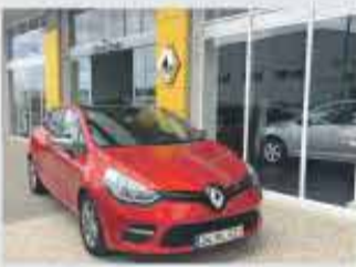
Renault Sport Tourer Gtline 1.5dci 90cv 2016.....16.990€