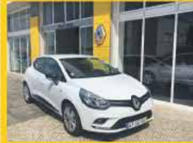
Renault Clio Limited TCE 90 CV 2018 15.300€