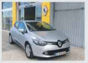
Renault Clio DYNAMIQUE S 1.5 dci 90 cv 2015.....14.990,00€