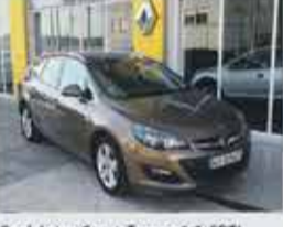
Opel Astra Sport Tourer 1.6 CDTI executive 2015 - 16,990€