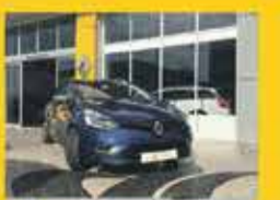
Clio ST GTLINE DCI 110Cv 22,200€