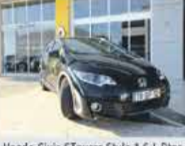
Honda Civic STourer Style 1.6 I-Dtec 120Cv -2016 - 19,990€