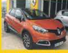
RENAULT CAPTUR EXCLUSIVE 1.5 DCI 90 CV 2017 18.500€