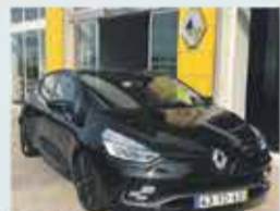
Renault Clio RS Trophy Turbo 220cv EDC 2017 - 29,900€