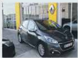
Peugeot 208 1.2 style 82 cv 2017 - 13,250€

Rua Norberto de Oliveira Nº8/10 Póvoa de Sto Adrião Tel 219 382 910 Fax 219 387 235