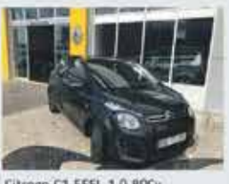
Citroen C1 FEEL 1.0 80Cv 2017 - 9,750€