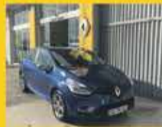
Renault Clio GT LINE 1.5 DCI 90 CV 2017 18.990€