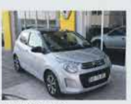
Citroen C1 1.0 FEEL 5 portas 2017 9 - 9,750€