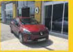
Renault Clio limited do 90cv 2017 16,950€