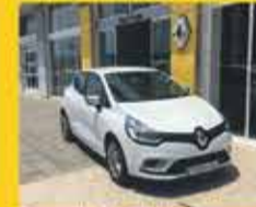
Renault Clio Gt line 1.5 dci 90cv 2018 21.250€