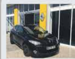
Renault Megane Sport Tourer Bose Edition DCI 130 CV 2013 - 17,250€