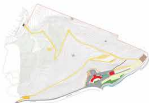
Parque Fonte das Avencas Requalificação do Parque e Áreas Envolventes AMADORA

Rua Engenheiro Pedro Appleton nº12 1685-353 Caneças Tel.: 21137 84 88 Tm.: 965 677 300 geral@gardinus.pt