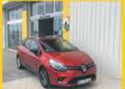
CLIO SPORT TOURER LIMITED DCI 90CV 2017 18.500€