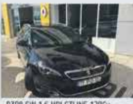
P306 SW 1.6 HDI GTLINE 120cv - 2015 - 21,990€