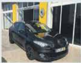
Renault Megane Sport Tourer Bose Edition DCI 110 CV 2013 - 16,990€