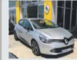
Renault Clio DYNAMIQUE 1.5 dci 90cv 2013...13,990€