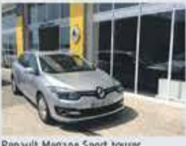
Renault Megane Sport Tourer dynamic DCI 110cv 2014 - 14,750€