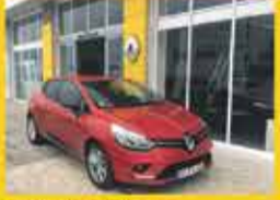
Renault Clio Limited DCI 90CV 2017 16,950€