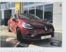
Clio GTLINE 0.9 Tce 90Cv - 2018 - 15,950€