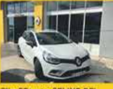
Clio STourer GTLINE DCI 110Cv - 2018 - 22,200€