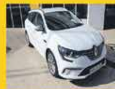
Renault Megane sport tourer GT Line 1.6 dci 130cv - 2018 - 27,500€