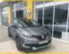
Renault Captur Exclusiv DCI 110CV 2018 21,990€