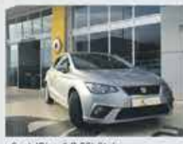
Seat Ibiza 1.0 FSI Style 2018 - 14,750€