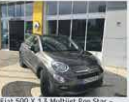
Fiat 500 X 1.3 Multijet Pop Star - 2016 - 16,990€