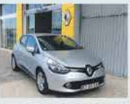
Renault Clio DYNAMIQUE S 1.5 dci 90 cv 2015.....14,450,00€