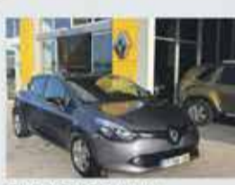
Renault Clio Dynamique 1.5 dci 90cv 2015...14,750€