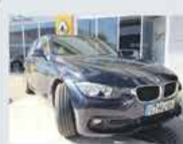
BMW 318d touring 2.0 150 cv Caixa automática 2016 - 31,900 €