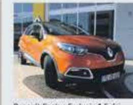
Renault Captur Exclusiv 1.5 dci 90cv 2013- 14,950€