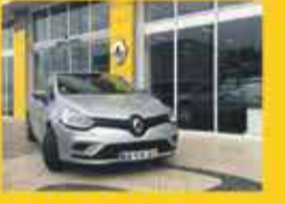
Clio GTLINE DCI EDC 90CV 2018 21,400€