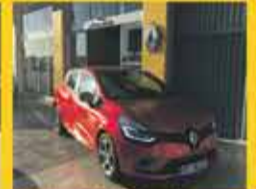
RENAULT CLIO GT LINE 1.5 DCI 90 CV 2017 18.990€