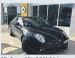
Alfa Romeo Mito 1.3 Multijet Distinctive 95Cv - 2010 - 10,900€