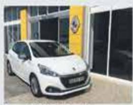
Peugeot 208 1.6 HDi Style 75cv 2016 - 15,450€