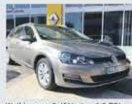
Wolkswagen Golf Varian 1.6 TDI 110cv GPS edition -22,250€