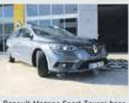
Renault Megane Sport Tourer Bose Edition EDC 1.5dci 110cv - 24,250€