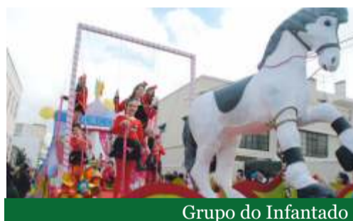
Grupo do Infantado