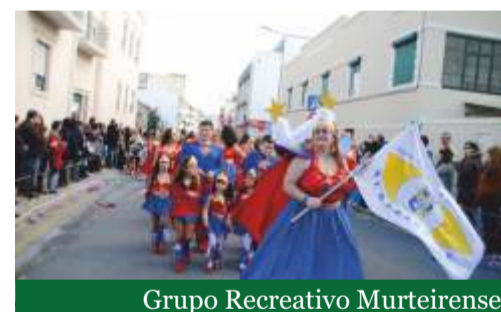
Grupo Recreativo Murteirense