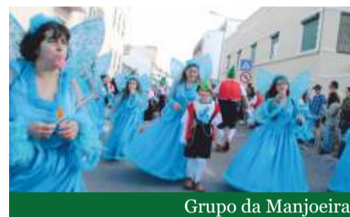
Grupo da Manjoeira