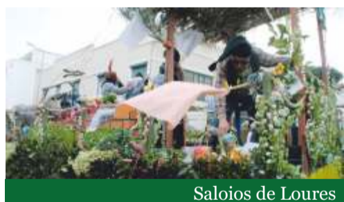
Saloios de Loures