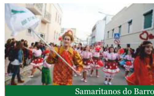
Samaritanos do Barro