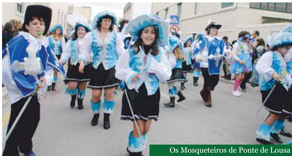
Os Mosqueteiros de Ponte de Lousa