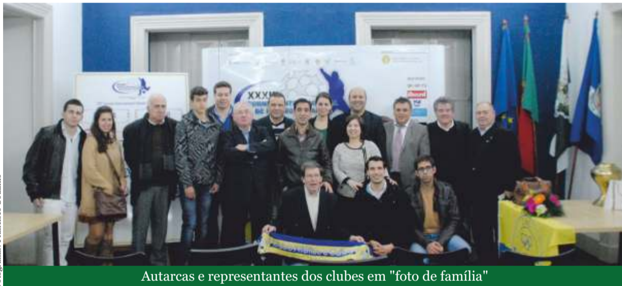
Autarcas e representantes dos clubes em "foto de família"