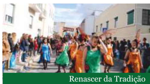
Renascer da Tradição

tradicional Cortejo Fúnebre e Leitura do Testamento do Rei Momo, seguido de fogo-de-artifício, no Parque da Cidade.