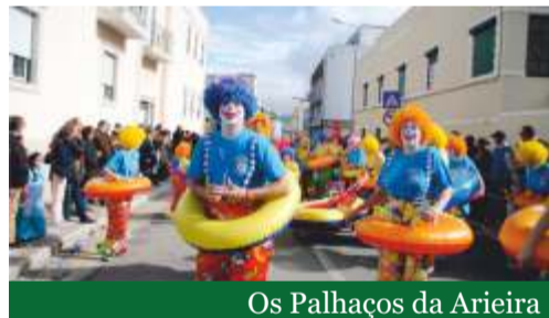
Os Palhaços da Arieira