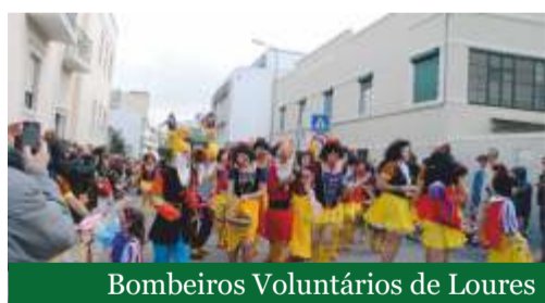
Bombeiros Voluntários de Loures