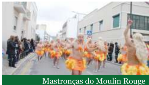
Mastronças do Moulin Rouge