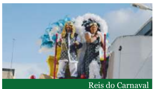
Reis do Carnaval