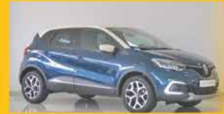
CAPTUR EXCLUSIVE 1.5 DCI 90CV - 2019 - 22700€ - 0KM