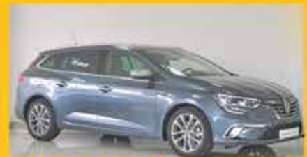
MEGANE IV ST GTLINE 115CV - 2019 - 24750€