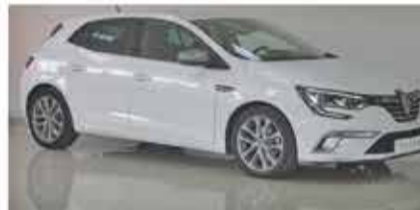
Megane GT line 5p 110 cv 2017 - 19900€