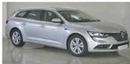
Talisman 1.6dci Itens 130CV EDC 2017 - 25990€