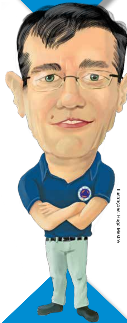
Ilustrações: Hugo Mestre