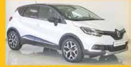
CAPTUR EXCLUSIVE 1.5 DCI 90CV - 2018 - 20900€