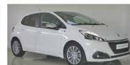
Peugeot 208 1.6 HDI 75CV STYLE - 2016 - 13900€