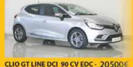
CLIO GT LINE DCI 90 CV EDC - 20500€