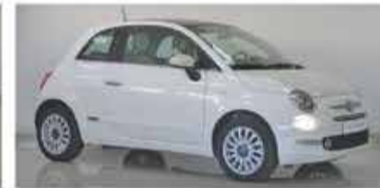
FIAT 500 U-CONNECT 1.2 GPS - 2017 - 12250€