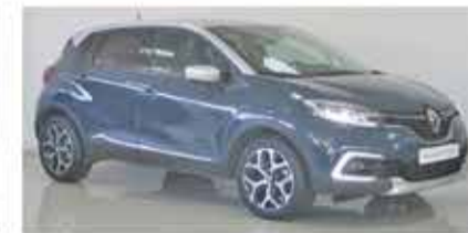
RENAULT CAPTUR 1.5 DCI EXCLUSIVE 110CV - 19900€ - 2018