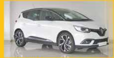
SCÉNIC BOSE EDITION 1.7 DCI 150CV - 2019 - 30500€