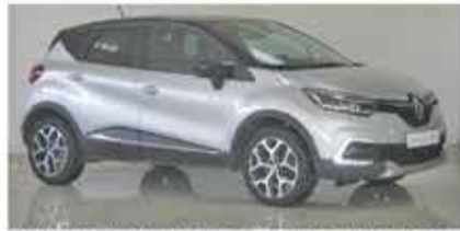
CAPTUR EXCLUSIVE 1.5 DCI 90CV X-MOD - 2018 - 19750€