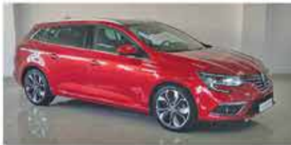
Renault Megane S.T. Bose 1.6DCI 130 CV EDC (cx Aut.) 2018 - 24900€