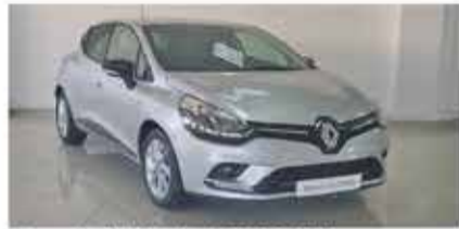
Renault Clio Limited TCE 90CV 2018 - 13990€