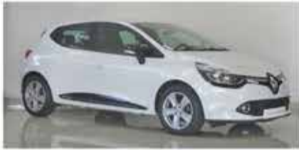
CLIO DYNAMIQUE S 1.5 DCI 90 CV - 2015 - 13500€