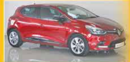
Clio Limited 90 cv 2017- 15750€