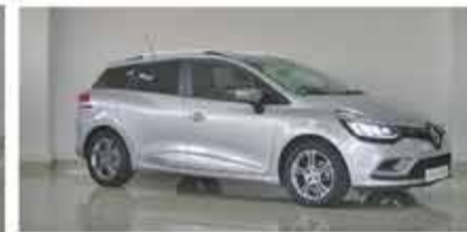
Clio ST GT line 90cv 2018 - 16900€