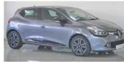
RENAULT CLIO 1.5 DCI DYNAMIQUE S 90 CV - 2015 - 14250€