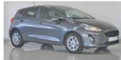
FORD FIESTA 1.0 TI-VCT BUSINESS 85 CV - 2018 - 13900€