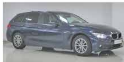
BMW 318 2.0D ADVANTAGE 150CV AUTO - 2016 - 29450€