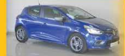
Clio GT Line 110cv 2018 - 20250€