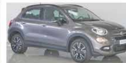
Fiat 500 X 1.3 Multijet start 95cv 2016 - 15900€