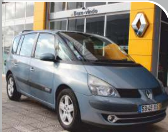
Renault ESPACE 7 lugares 14.000€ 1.9 dCi 120 CV 2004 147.302 Km's