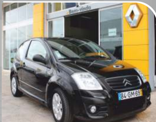
Citroen C2 VTR 6.000€ 1.1 60 CV 2008 53.379 Km's