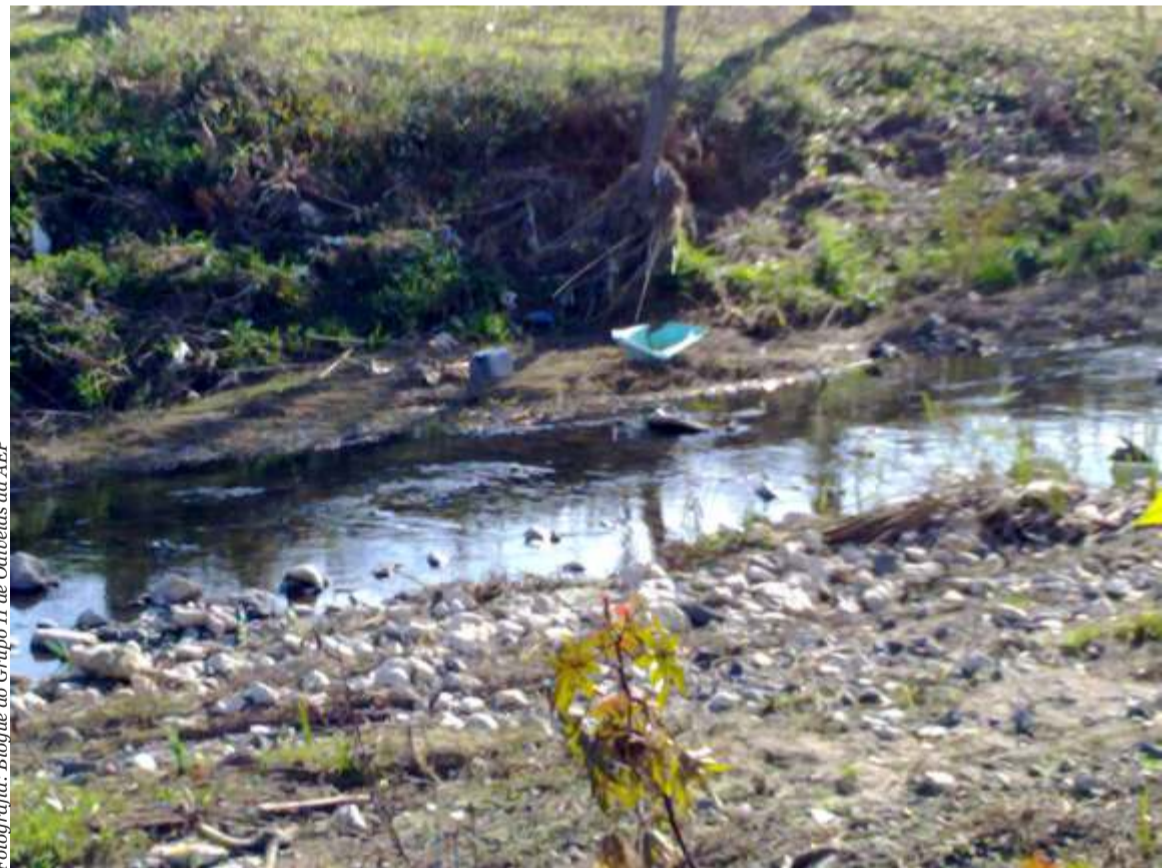
Fotografia: Bloqueio do Grupo 11 de Odivelas da AEP

consequências desastrosas para o país e para a economia nacional que perderá o controlo de um setor estratégico; para os municípios, cujo papel ficará significativamente reduzido, além da pressão que advirá no sentido da liquidação dos sistemas; para os trabalhadores, porque põe em causa os seus postos de trabalho e os seus direitos; para as populações, que passam a ter um serviço que lhes é prestado por uma empresa privada, que visa o máximo lucro através do aumento dos montantes das taxas, penalizando ainda mais o fraco rendimento das famílias; para o ambiente, abrindo caminho a um recuo dos níveis de qualidade alcançada».