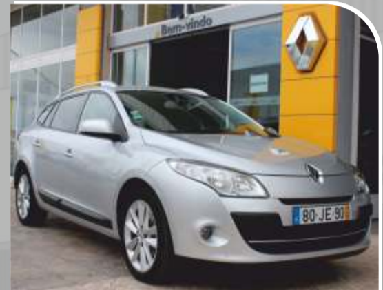
Renault Megane Sport Tourer Dynamique S 15.500€ 1.5 dCi 110 CV 2010 49463 Km's