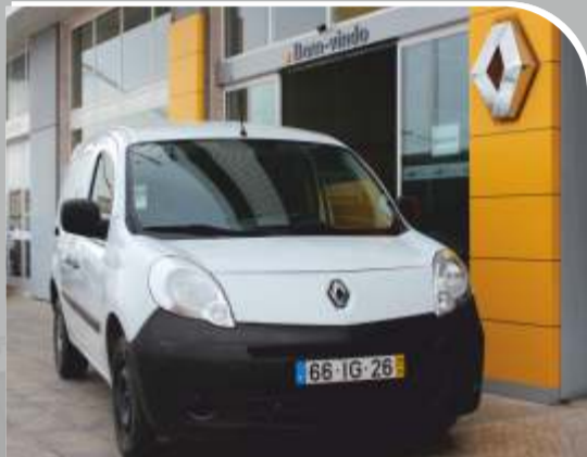
Renault Kangoo Super Pack Clim 7.500€ (Iva Incluído) 1.5 dCi 70 CV 2009 102.000 Km's