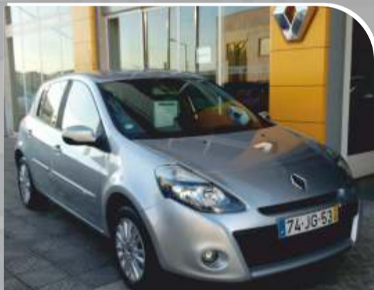
Renault Clio Dynamique 8.500€ 1.2 16v 75 CV 2010 88971 Km's