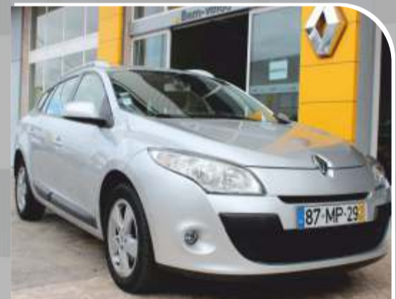
Renault Megane Sport Tourer Dynamique 17.450€ 1.5 dCi 110 CV 2012 60916 Km's