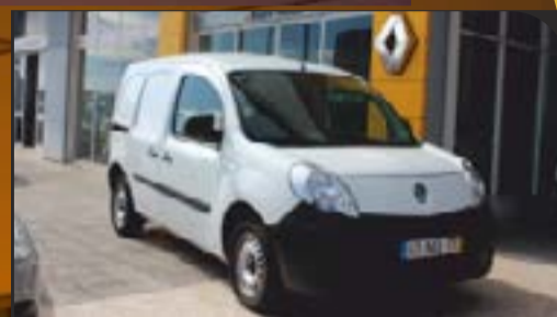
Renault KANGOO SUPER PACK CLIM 1.5 DCI 70 cv 2013 10500,00€