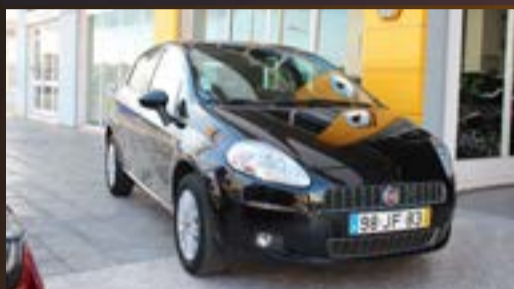
Fiat Grand Punto 1.2 Free 5p. 2010 6950,00€