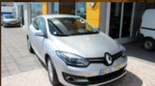
Renault Megane Berlina Dynamique S 1.5 dci 110 cv 2014 20 000,00€