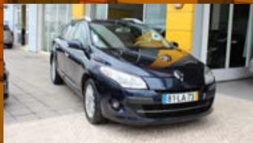
Renault Megane Sport Tourer LUXE 1.5 DCI 110 CV 2010 15 450,00€