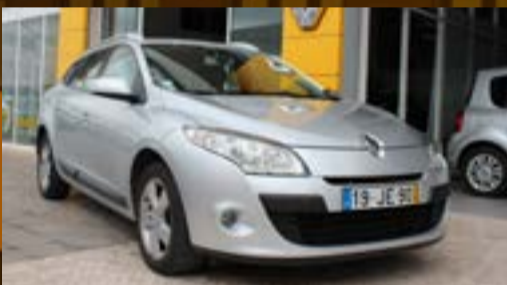
Renault Megane Sport Tourer Dynamique 1.5 dci 110 cv 2010 14 750,00€