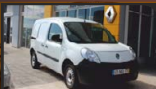
Renault KANGOO SUPER PACK CLIM 1.5 DCI 70 cv 2012 9500,00€