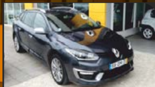
Renault Megane Sport Tourer GT LINE 1.5 DCI 100 CV 2014 21900,00€